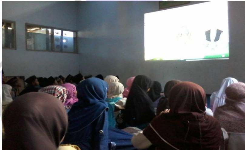
Kegiatan Pembelajaran Dengan Menggunakan Media Video