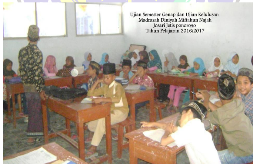
Ujian Semester Genap dan Ujian Kelulusan Madrasah Diniyah Miftahun Najah Josari Jetis ponorogo Tahun Pelajaran 2016/2017