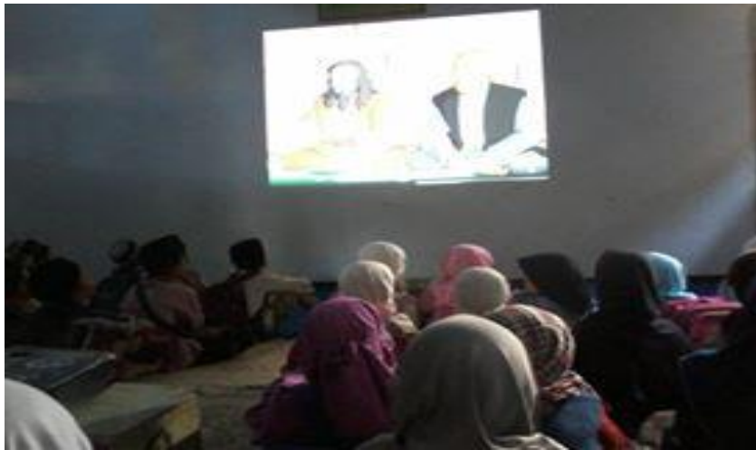
Kegiatan Pembelajaran Dengan Menggunakan Media Video