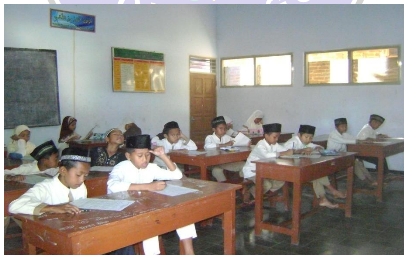
Kegiatan Belajar Mengajar