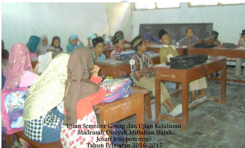
Ujian Semester Genap dan Ujian Kelulusan Madrasah Diniyah Miftahun Najah Josari Jetis ponorogo Tahun Pelajaran 2016/2017