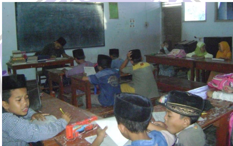
Suasana Kelas Madin Miftahunnajah