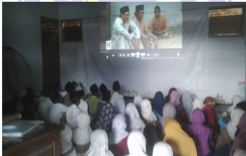
Kegiatan Pembelajaran Dengan Menggunakan Media Video