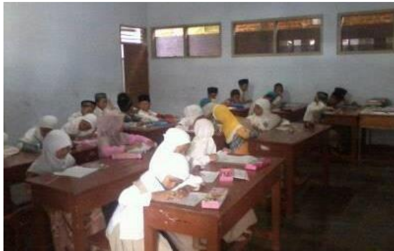
Suasana Kegiatan Pembelajaran Di Madin Miftahun najah