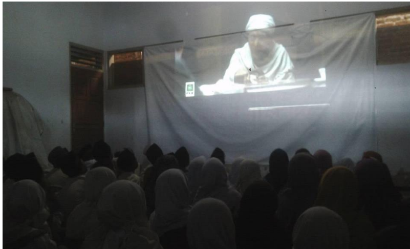
Kegiatan Pembelajaran Dengan Menggunakan Media Video