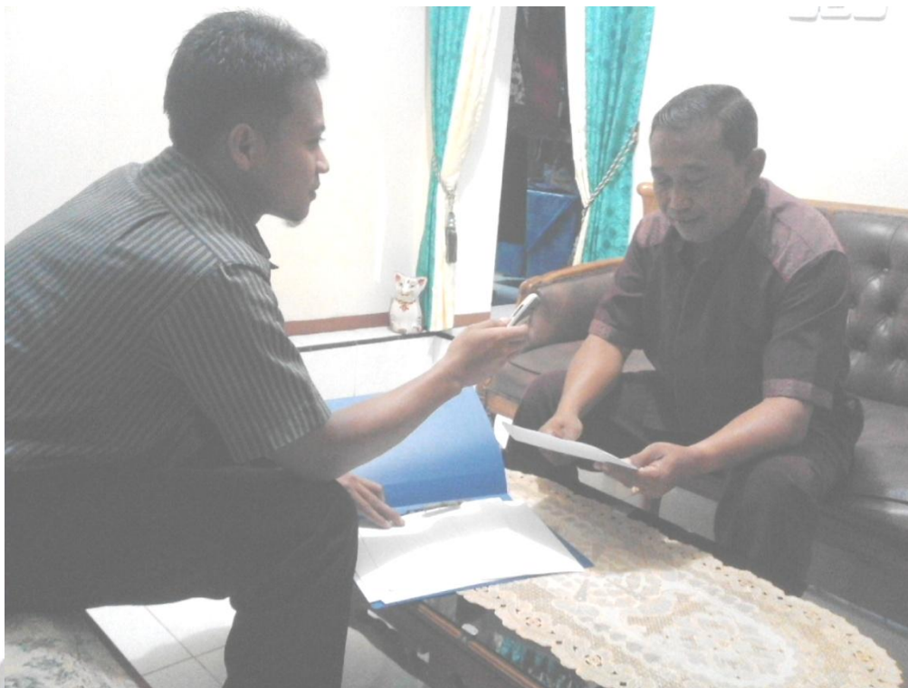
Wawancara bersama ketua BPD Desa Tegalombo