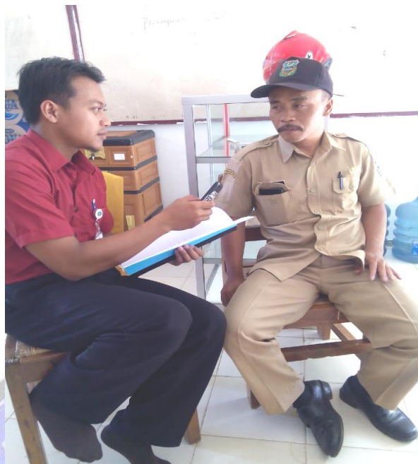
wawancara bersama bapak PJ Kepala Desa Tegalombo