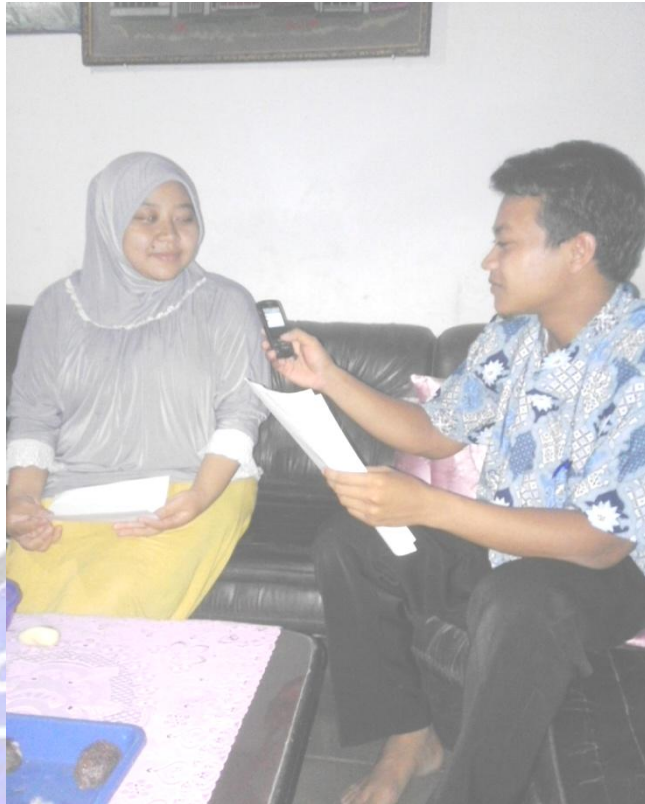
Wawancara bersama kaur pemerintahan