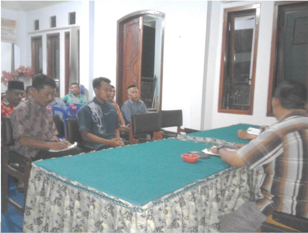
Ikut menghadiri rapat BPD dan Pemerintah desa dalam rangka perumusan peraturan pasar Tegalombo