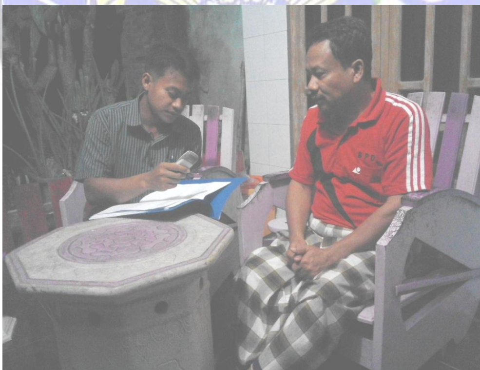
Wawancara bersama sekretaris BPD Desa Tegalombo