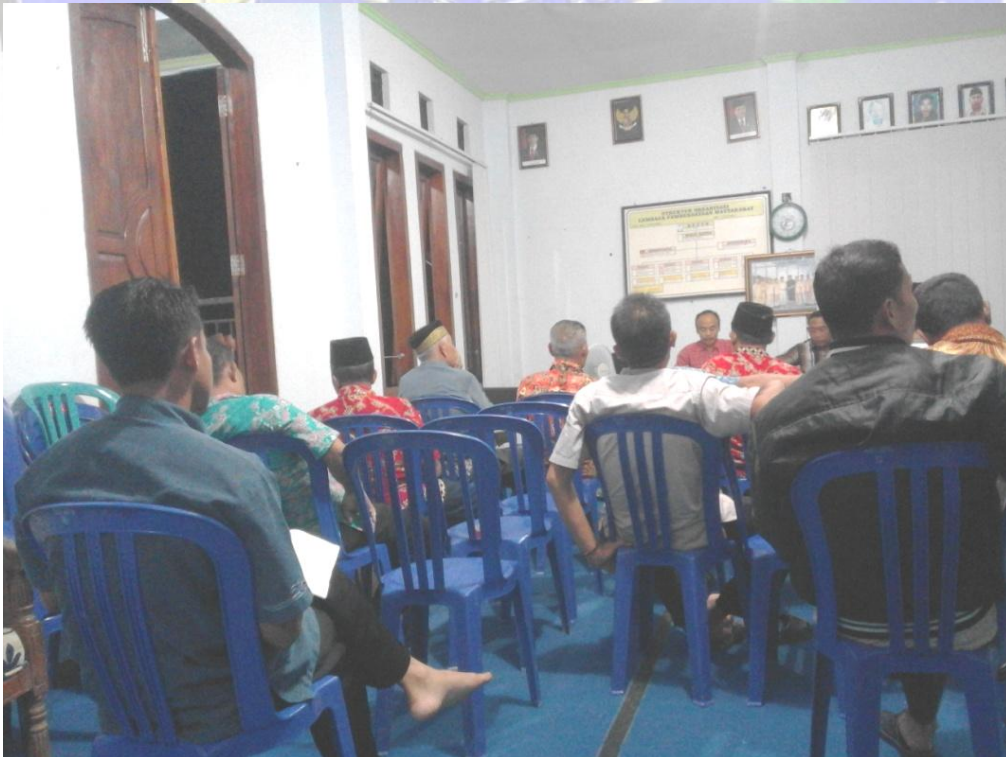
Obvesvasi pada saat rapat berlangsung