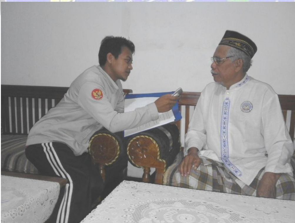
Wawancara bersama anggota BPD Desa Tegalombo