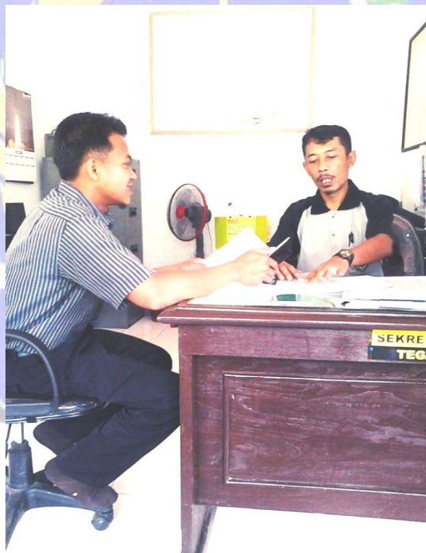
Wawancara bersama Bapak sekretaris Desa Tegalombo