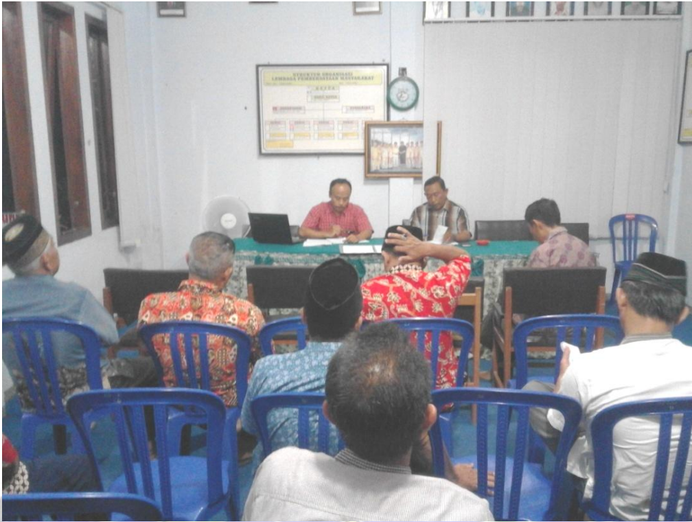
Kepala desa dan ketua BPD sedang memimpin rapat