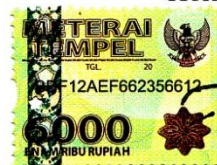
Toni Setio Cahyono