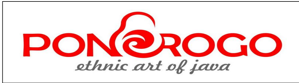
FOTO CITY BRANDING KABUPATEN PONOROGO