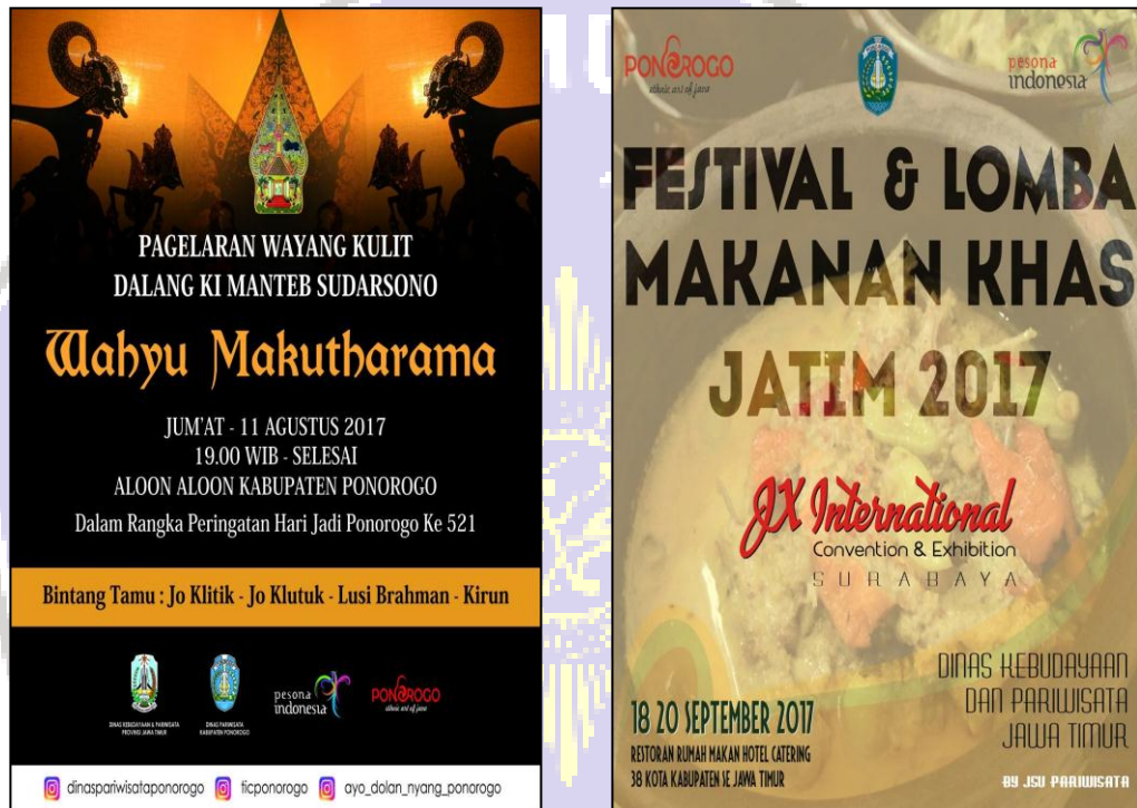
Foto dibawah adalah penerapan city branding Kabupaten Ponorogo “Ponorogo Ethnic Art of Java” Pada media promosi Dinas Pariwisata Kabupaten Ponorogo pada setiap acara Kabupaten Ponorogo.