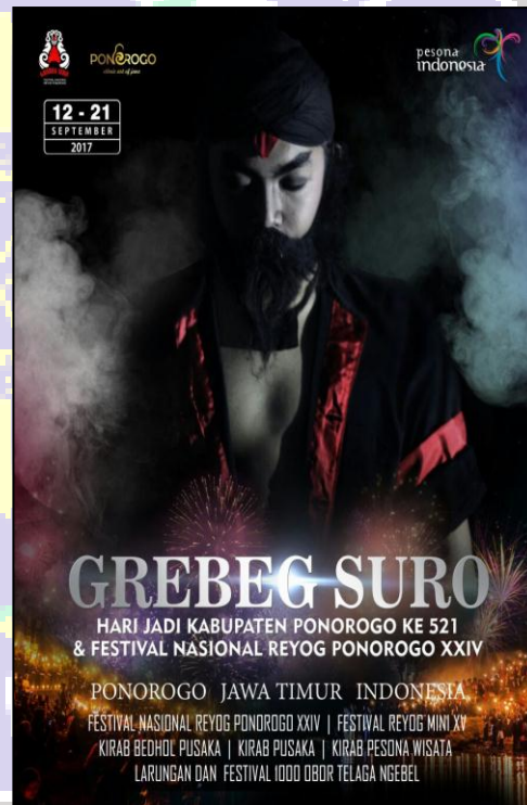
Foto diatas adalah penerapan city branding Kabupaten Ponorogo “Ponorogo Ethnic Art of Java” Pada media promosi Dinas Pariwisata Kabupaten Ponorogo pada setiap acara Kabupaten Ponorogo