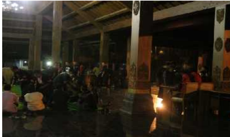
Tamu undangan memasuki tempat acara Sarahsehan