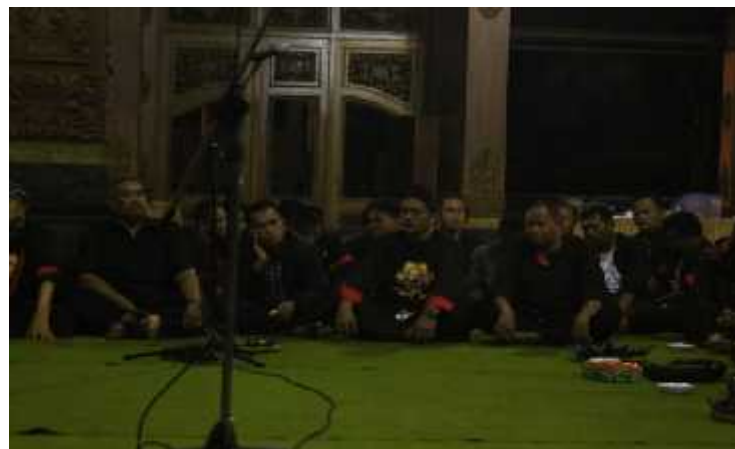
( Acara Sarahsehan Segera Dimulai Tamu Undangan Menempati Ruangan )