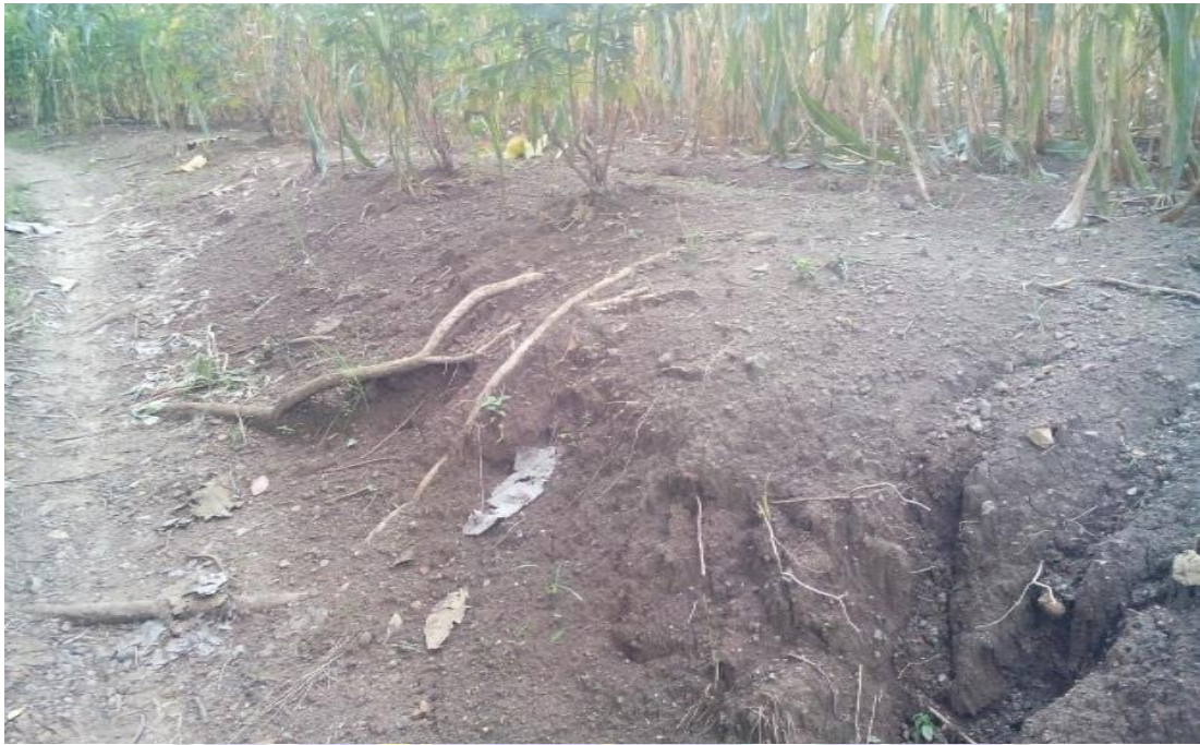
Gambar 9 : Kondisi Lahan a