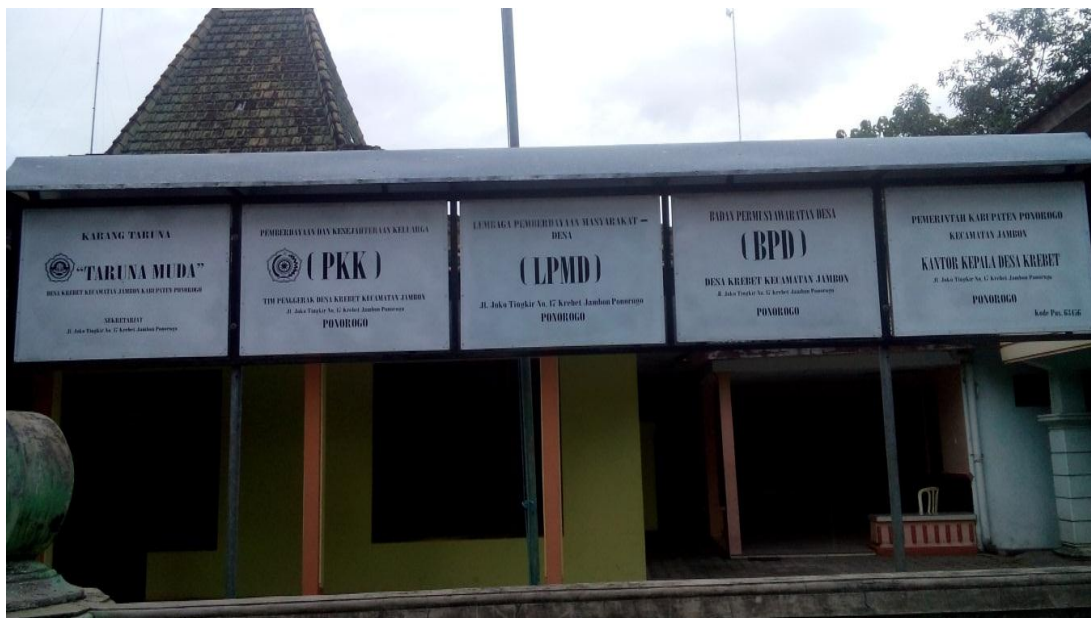
Gambar 1. Balai Desa Kreet