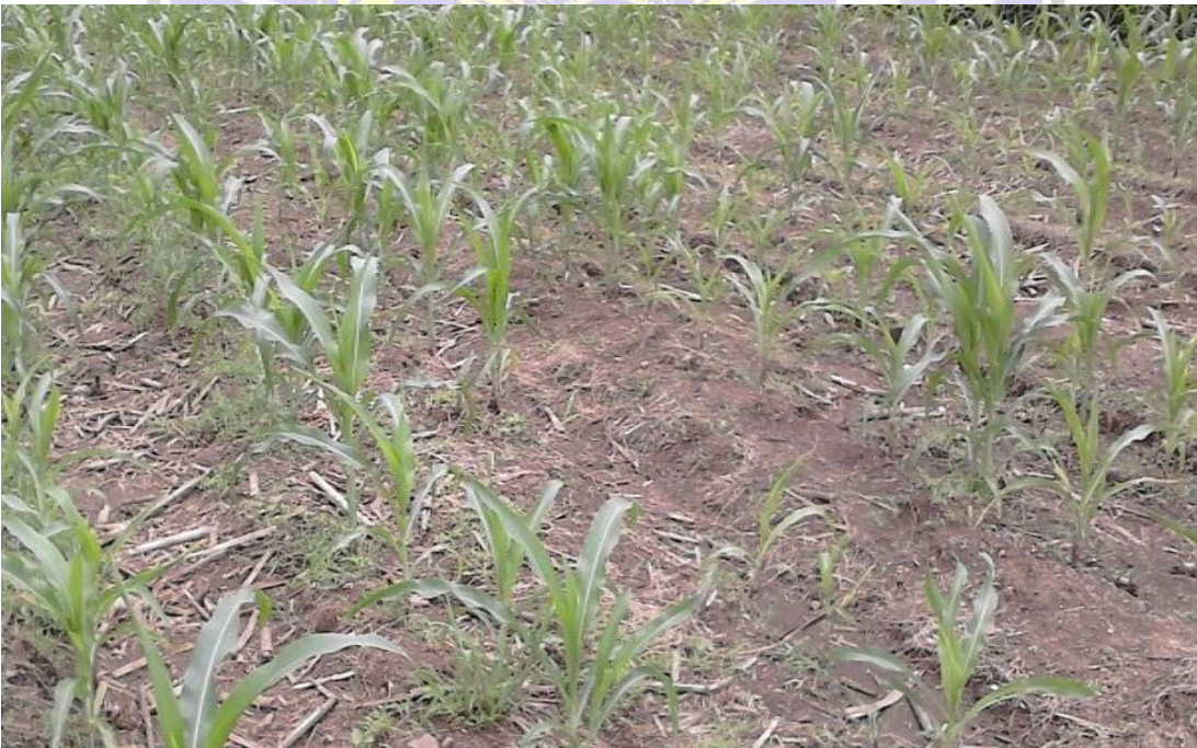
Gambar 10 : Kondisi Lahan b