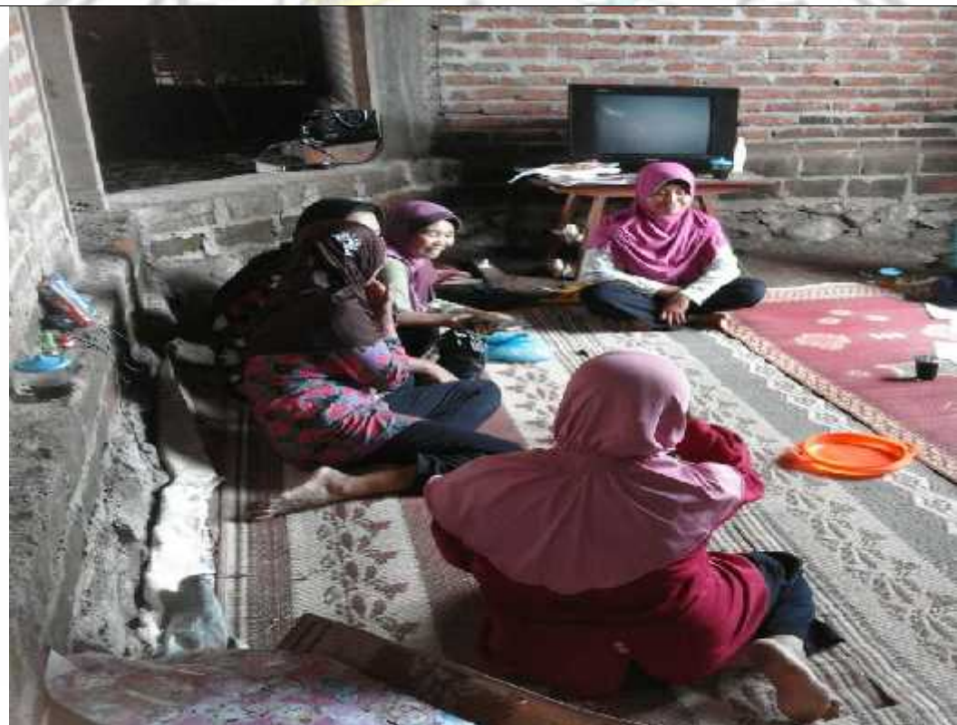
Wawancara dengan Anggota Kelompok Wanita Tani