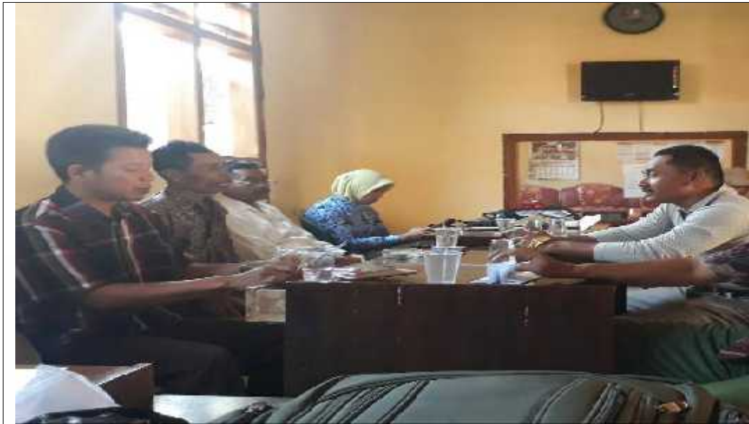
Wawancara bersama kepala Desa Karangpatihan dan Staf