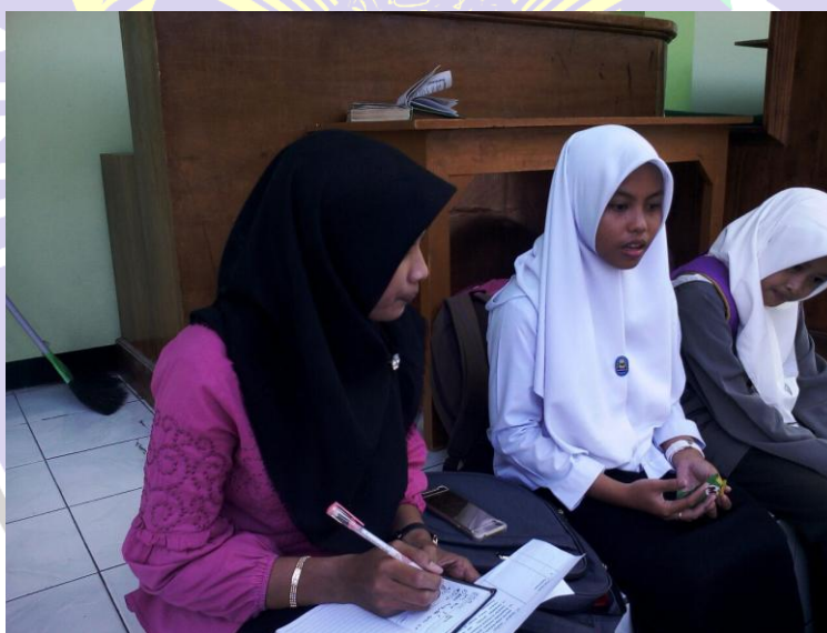
Sumber santriwati Pondok Pesantren Darul Huda Mayak Ponorogo