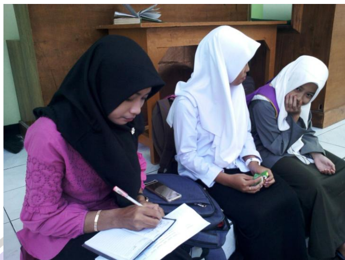
Sumber santriwati Pondok Pesantren Darul Huda Mayak Ponorogo