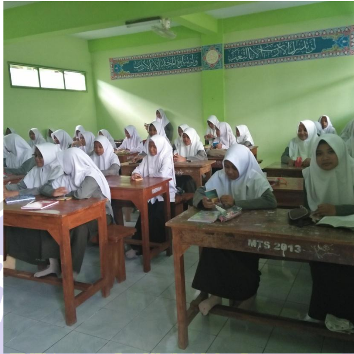
Sumber Kegiatan belajar Santriyah di Pondok Pesantren Darul Huda Mayak Ponorogo