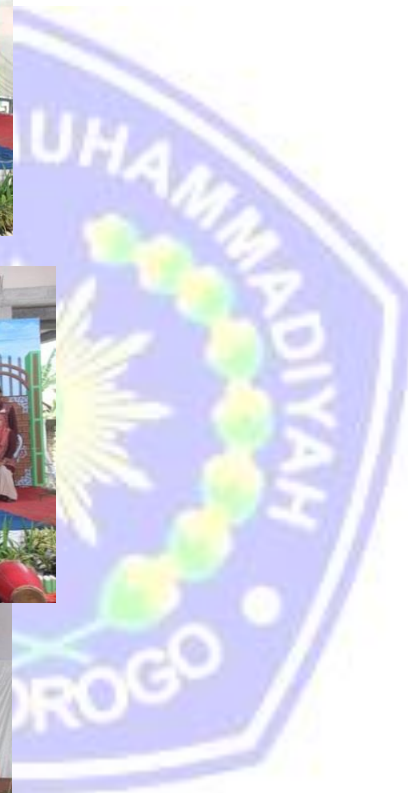
POSE SETELAH SERTIFIKASI QURU AL-QURAN DAN ACARA KHOTAMAN