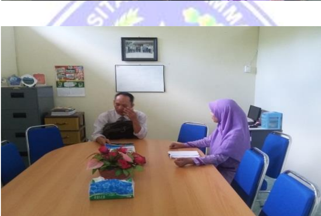
PENELITI DAN KEPALA MADRASAH SERTA WAKA KESISWAAN