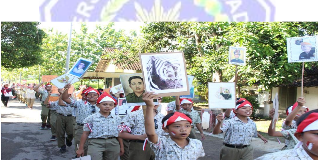
KIRAB MEMPERINGATI HARI PAHLAWAN