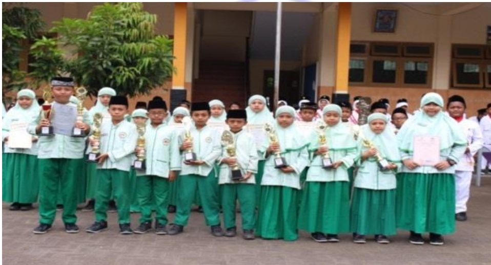
PEMBERIAN PENGHARGAAN KEPADA JUARAN AKSIOMA 2017