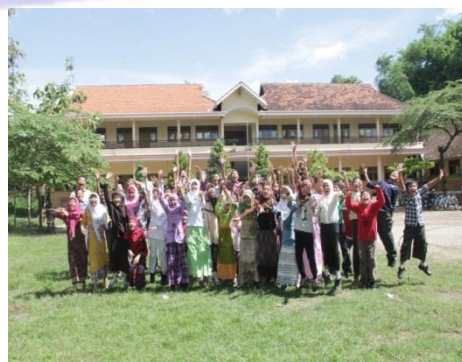
KEGIATAN MEMPERINGATI TAHUN BARU ISLAM