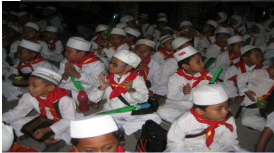
KEGIATAN TAKBIR KELILING