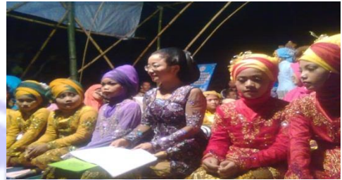
PENTAS SENI KARAWITAN