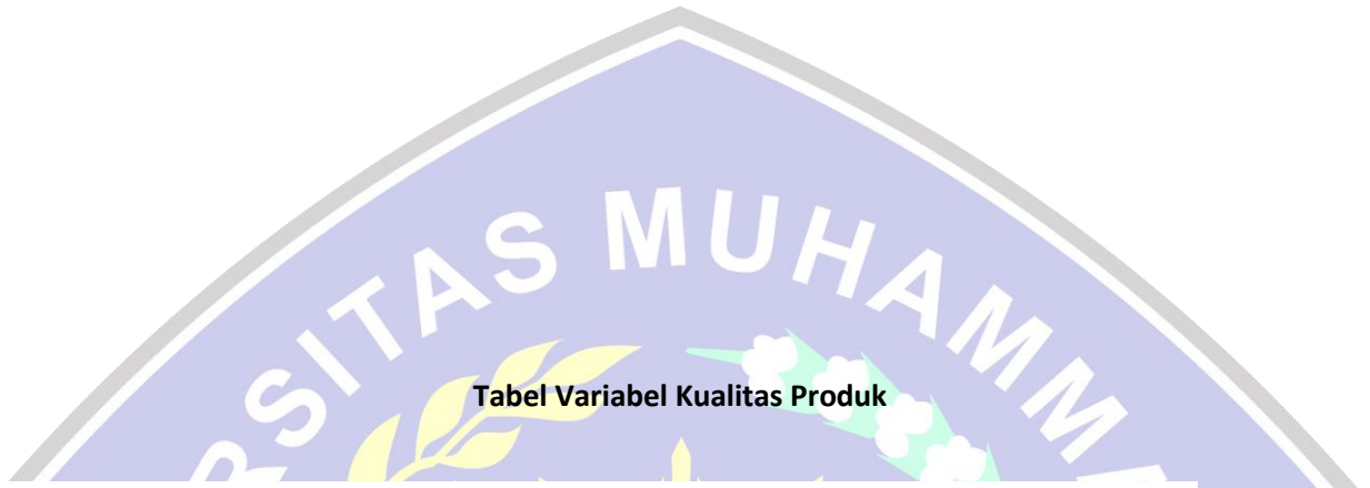
Tabel Variabel Kualitas Produk

** . Correlation is significant at the 0.01 level (2-tailed).