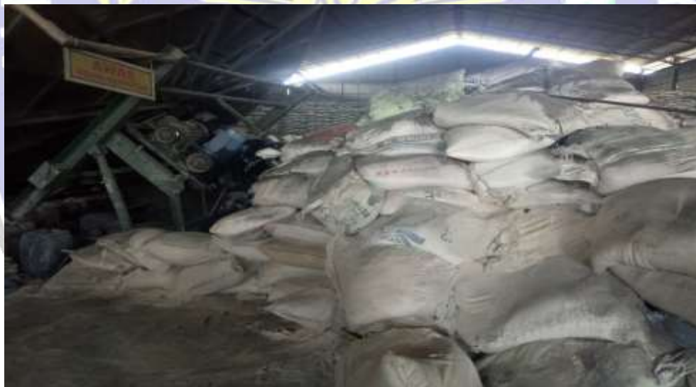
Dokumentasi persediaan bahan baku dolomit