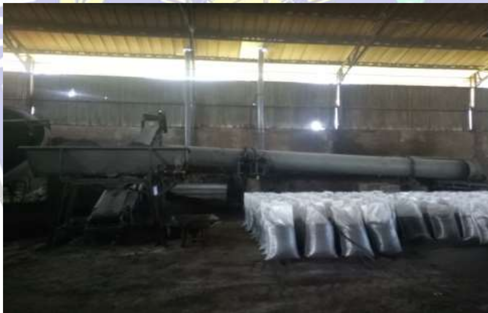
Dokumentasi mesin oven dan mesin screen atau pengayak granulator