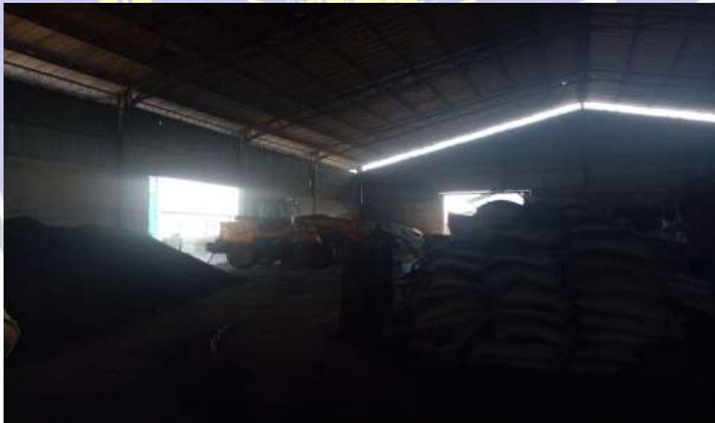
Dokumentasi gudang CV. Surya Indah Mulia sekaligus dengan tempat produksi