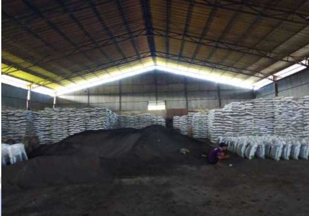
Dokumentasi pupuk yang telah dipacking