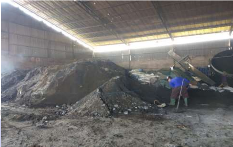
Dokumentasi pencampuran bahan baku dan bahan pembantu