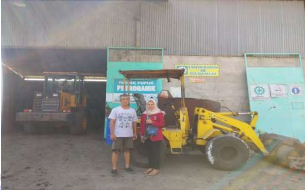
Dokumentasi pabrik pupuk petroganik CV. Surya Indah Mulia Madiun