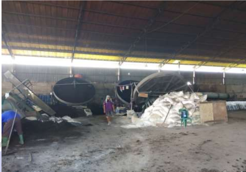
Dokumentasi pembuatan granule pupuk dengan pan granulator