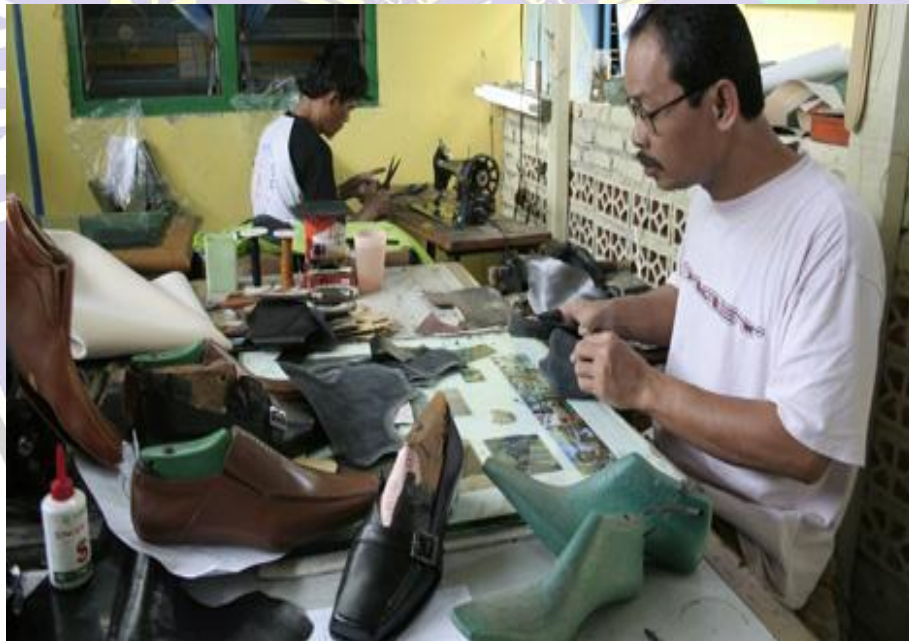
Pola di potong dan dijahit dengan mesin jahit