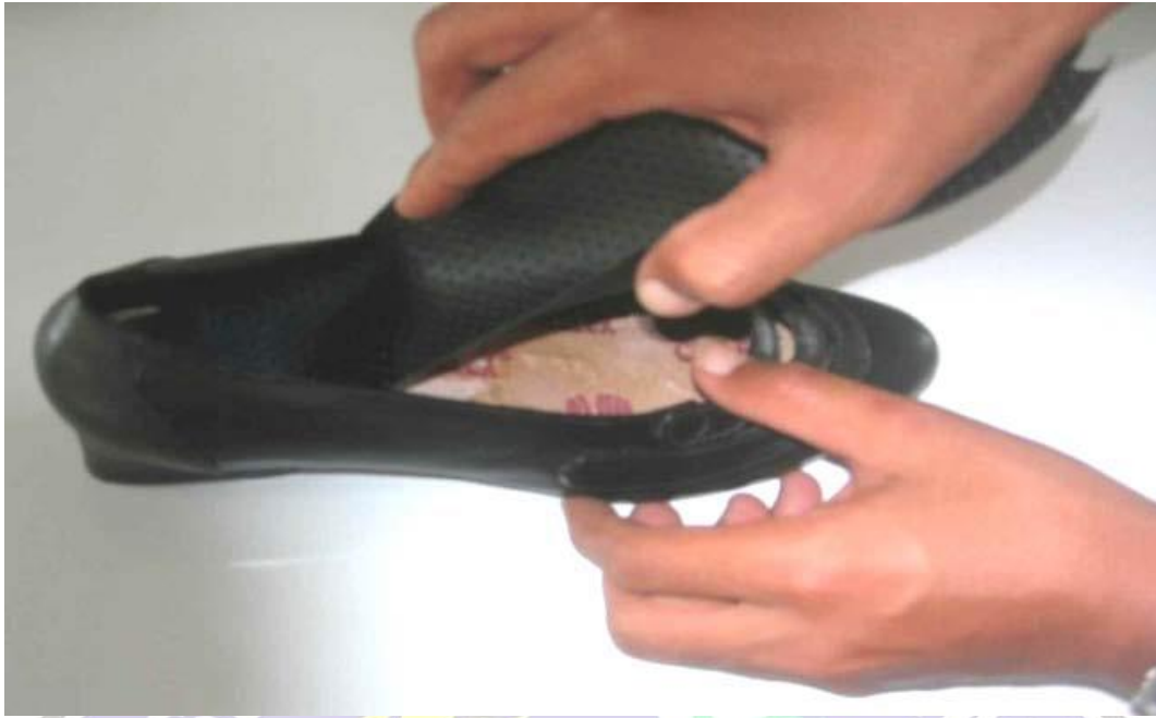
pemberian lemek sepatu