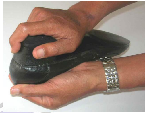
Pemasangan sole sepatu bagian luar dan hak sepatu