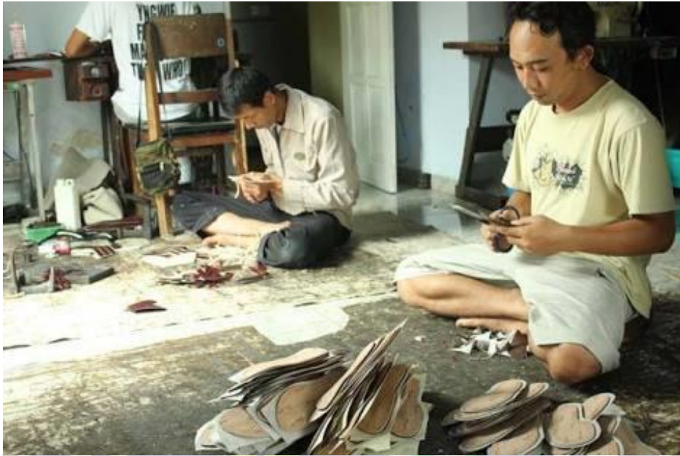
Pembuatan dan penentuan sole sepatu sesuai model sepatu