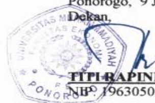
TITI RAPINI, SE, MM