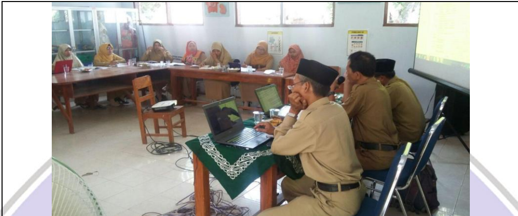
Rapat kerja guru

Kode : 01/O/8/2018 Tanggal : 23 Juli 2018,09.00 WIB Disusun jam : 23 Juli 2018,20.00 WIB Topik : Rapat kerja guru Dokumentasi