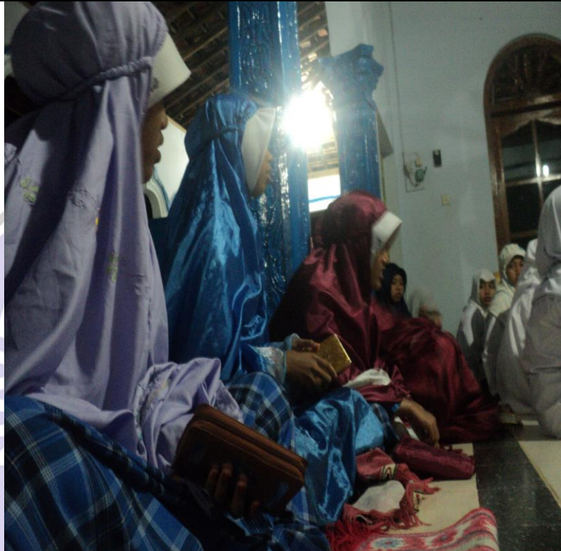
kegiatan karakter religius

Kode : 03/O/8/2018 Tanggal : 23 Juli 2018,09.00 WIB Disusun jam : 23 Juli 2018,20.00 WIB Topik : Karakter religius Dokumentasi