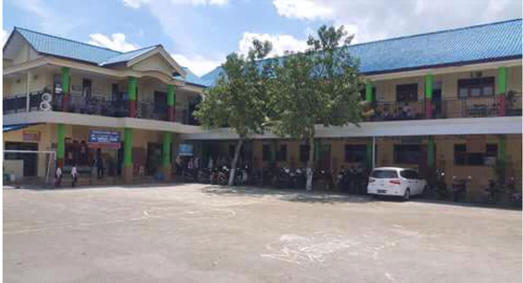
Foto gedung sekolah MI Darul Fikri