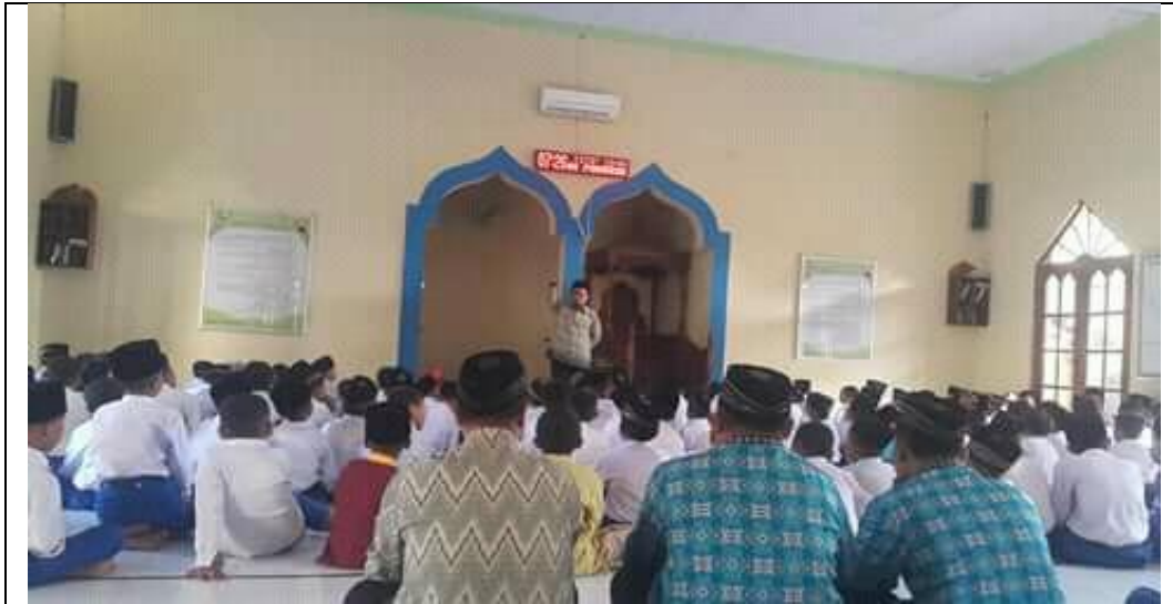
Foto kegiatan tausiyah atau bimbingan setelah sholat dhuha