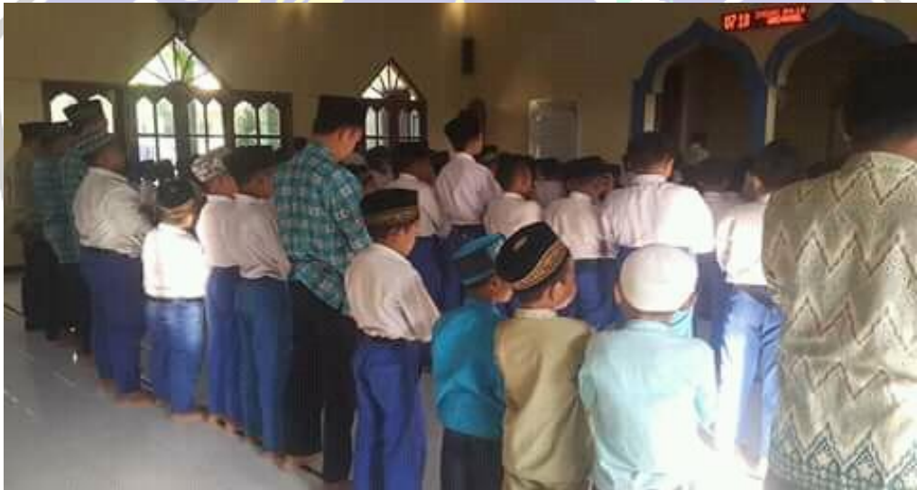
Foto kegiatan sholat dhuha