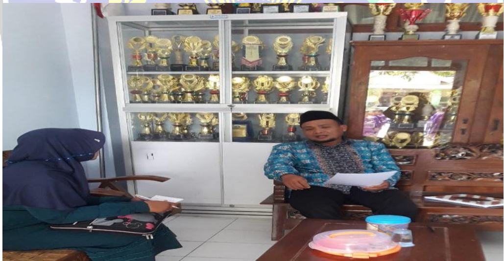
Foto wawancara dengan kepala sekolah MI Darul Fikri