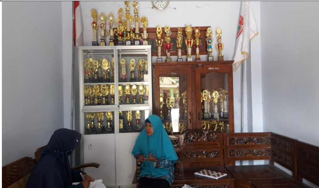
Foto wawancara dengan guru BK MI Darul Fikri