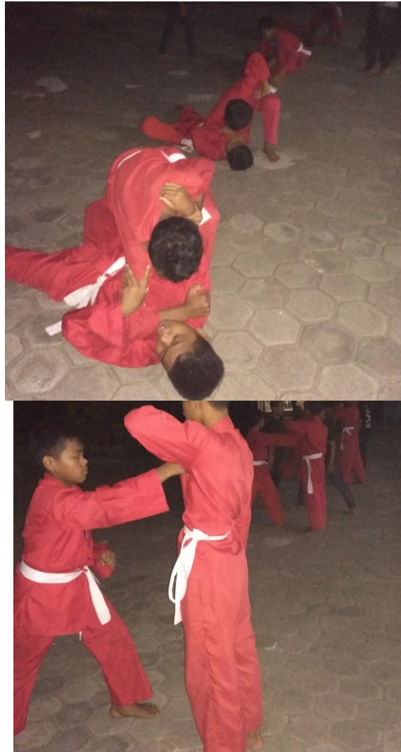
Kegiatan olahraga beladiri remaja Desa Gombang