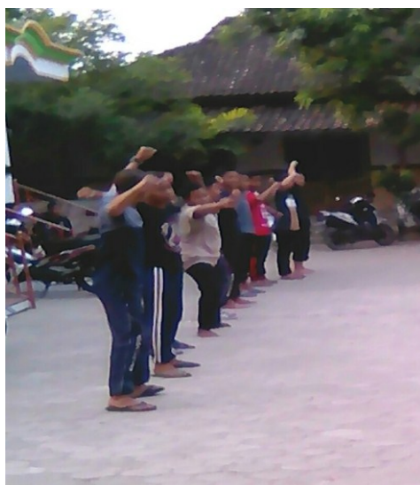
Kegiatan Latihan Tari Reog Remaja Desa Gombang