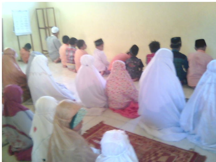
Kegiatan pembenahan bacaan dan gerakan sholat dan mengaji remaja Desa Gombang

Kode : 02/O/V/2018 Tanggal : 22 Juni 2018, 15.00 WIB Disusun jam : 02 Juli 2018, 20.00 WIB