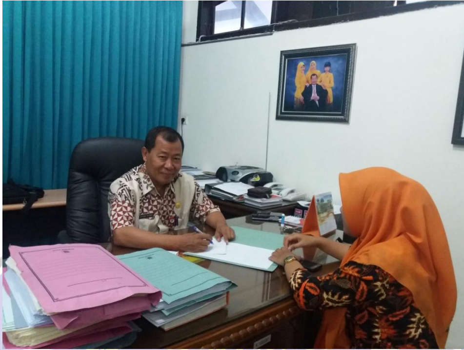
Wawancara dengan Kepala Dinas Kependudukan dan Pencatatan Sipil Kabupaten Ponorogo