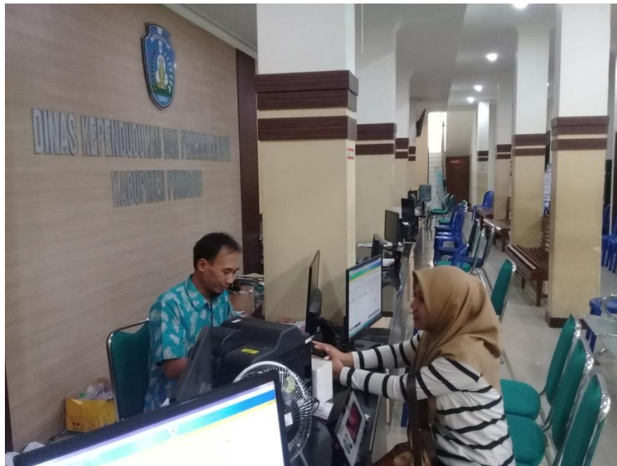
Wawancara dengan Staf Operator Cetak e-KTP di Dinas Kependudukan dan Pencatatan Sipil Kabupaten Ponorogo