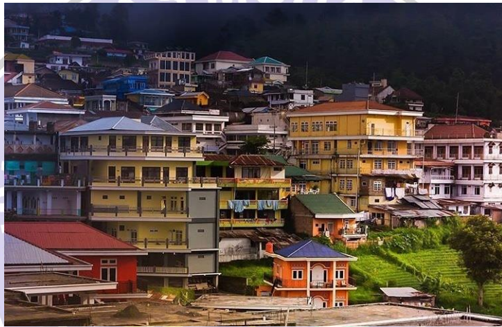
(Penginapan di Kawasan Telaga Sarangan)