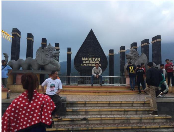
(Patung landmark di sekitar Telaga Sarangan)