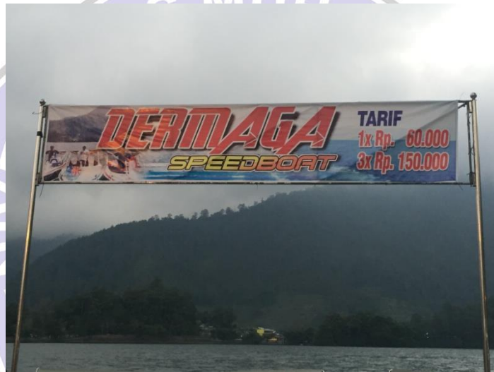
(Dermaga speedboat di sekitar Telaga Sarangan)