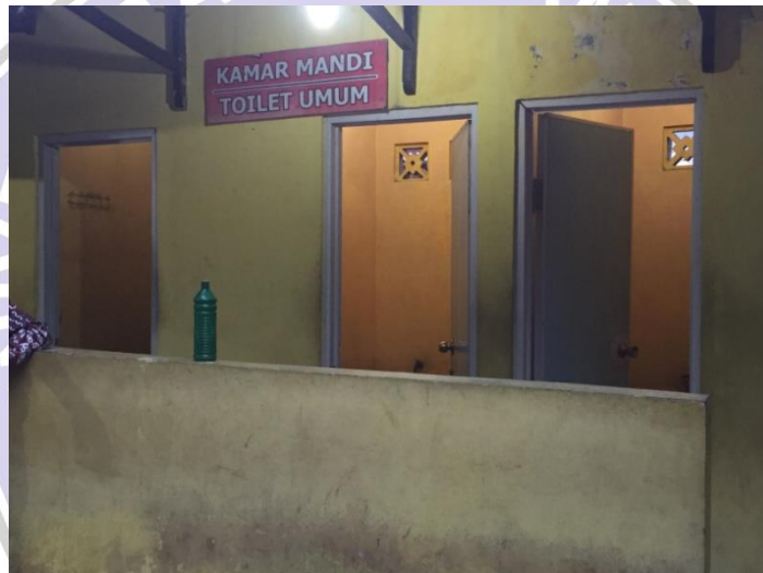
(Kamar mandi di sekitar Telaga Sarangan)