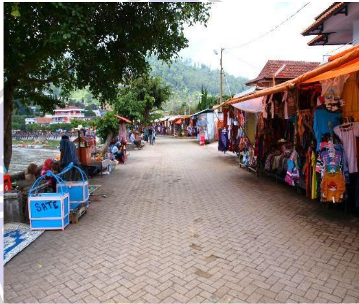
(Pusat oleh-oleh dan kuliner di Kawasan Telaga Sarangan)