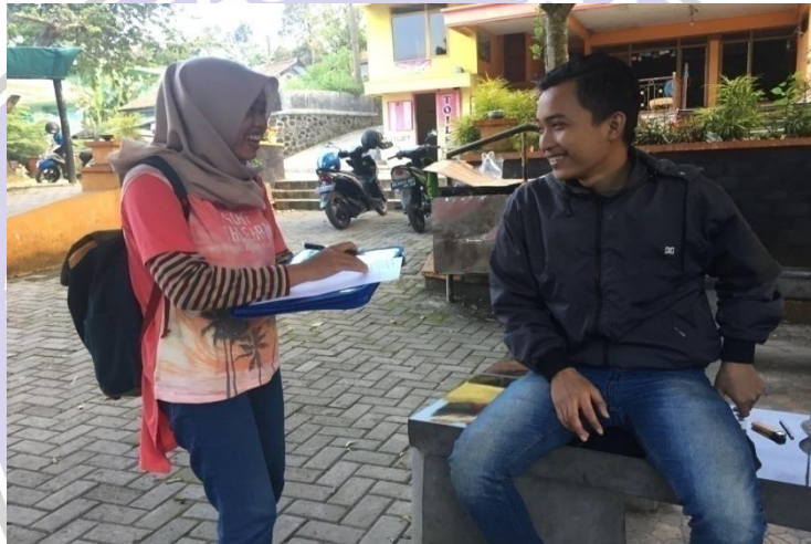
(Wawancara dengan Mas Nova selaku wisatawan asal Walikukun)