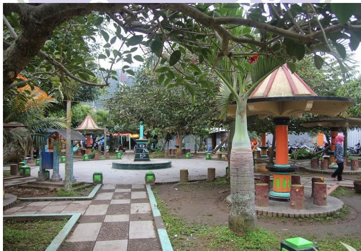
(Taman bermain di Kawasan Telaga Sarangan)