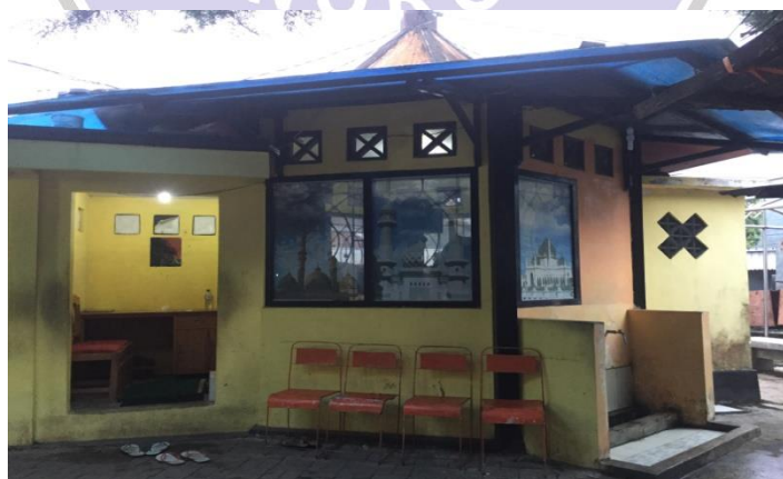
(Mushola di sekitar Telaga Sarangan)