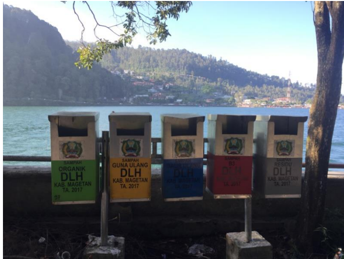
(Tempat sampah di sekitar Telaga Sarangan)