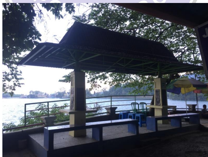
(Gazebo di sekitar Telaga Sarangan)