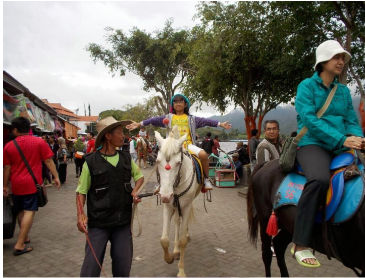
(Jasa sewa kuda di Kawasan Telaga Sarangan)