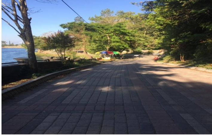
(Infrastruktur jalan menuju Kawasan Telaga Sarangan)