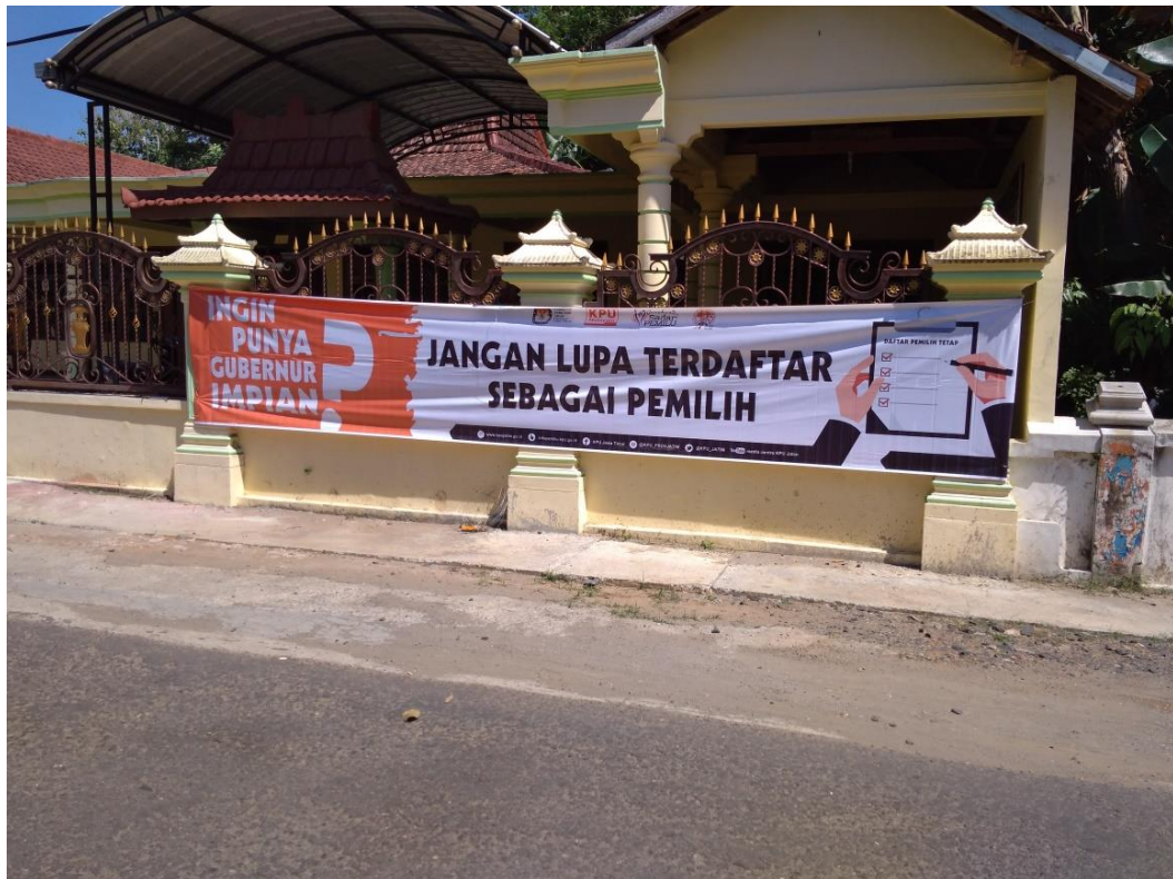
Gambar 3. Sosialisasi di Tempat Umum