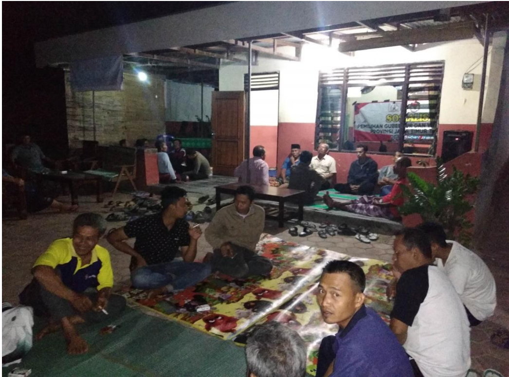
Gambar 2. Sosialisasi Masyarakat pada acara genduren