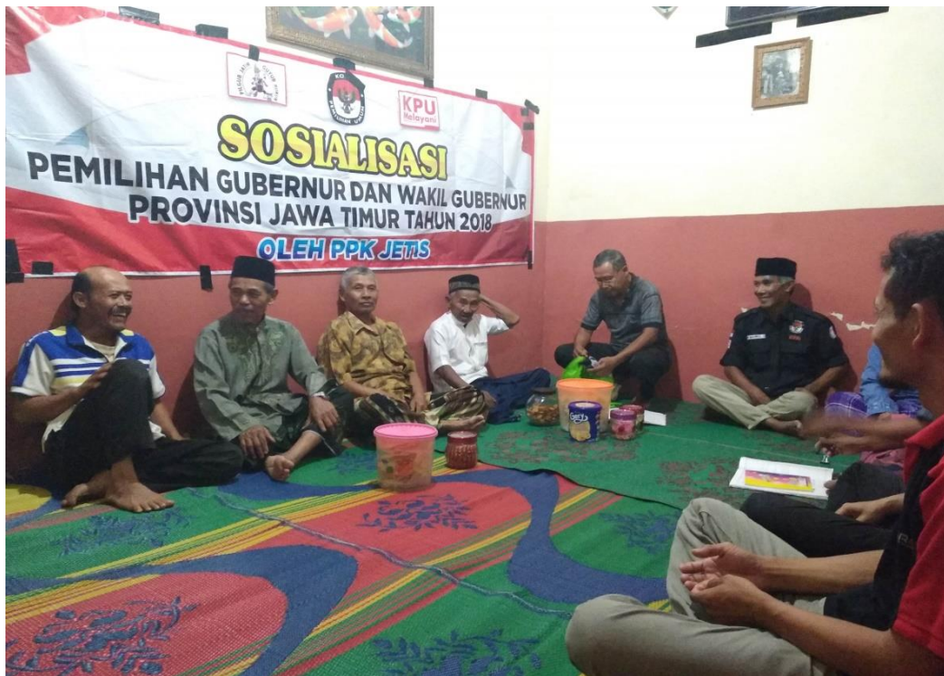
Gambar 1. Sosialisasi pada acara Arisan RT