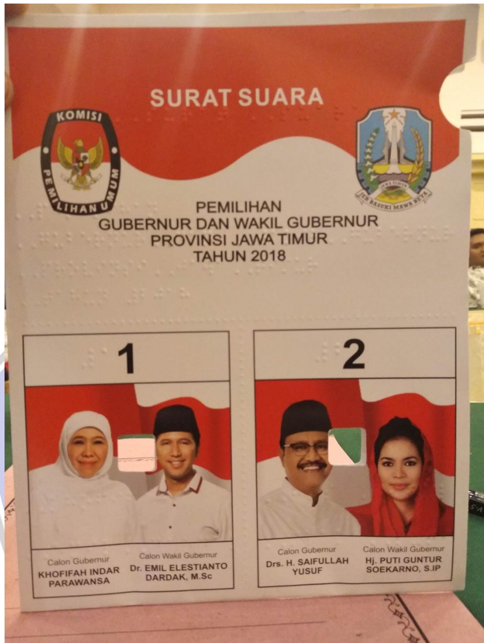
Gambar 4. Sosialisasi untuk disabilitas