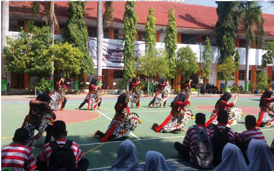
Kesenian Tari Jathilan tampil didepan siswa baru