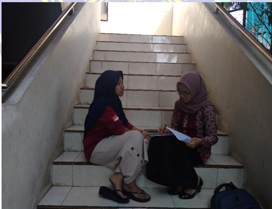
Wawancara dengan siswa