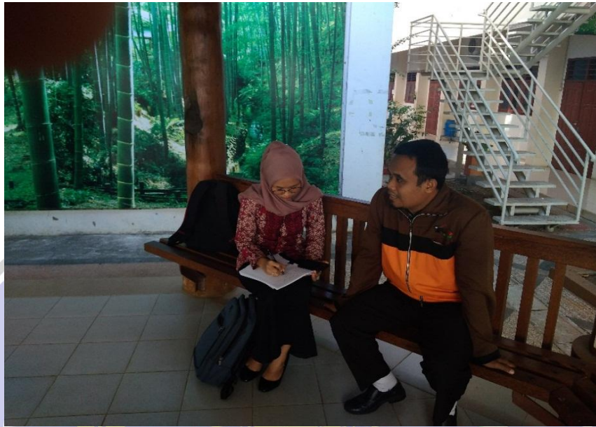
Wawancara dengan Pembina kesenian tari jathilan SMA Muhammadiyah 1 Ponorogo