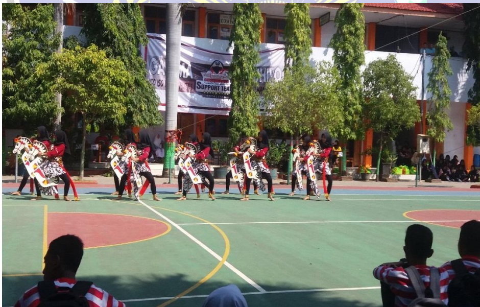
Kesenain tari jathilan tampil didepan siswa baru