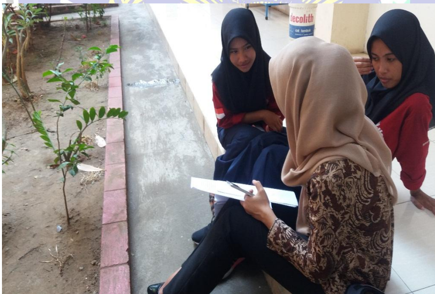
Wawancara dengan siswa