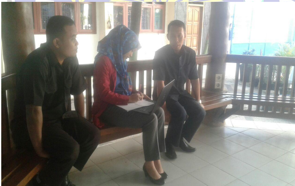
Wawancara dengan Guru PPKn SMA Muhammadiyah 1 Ponorogo