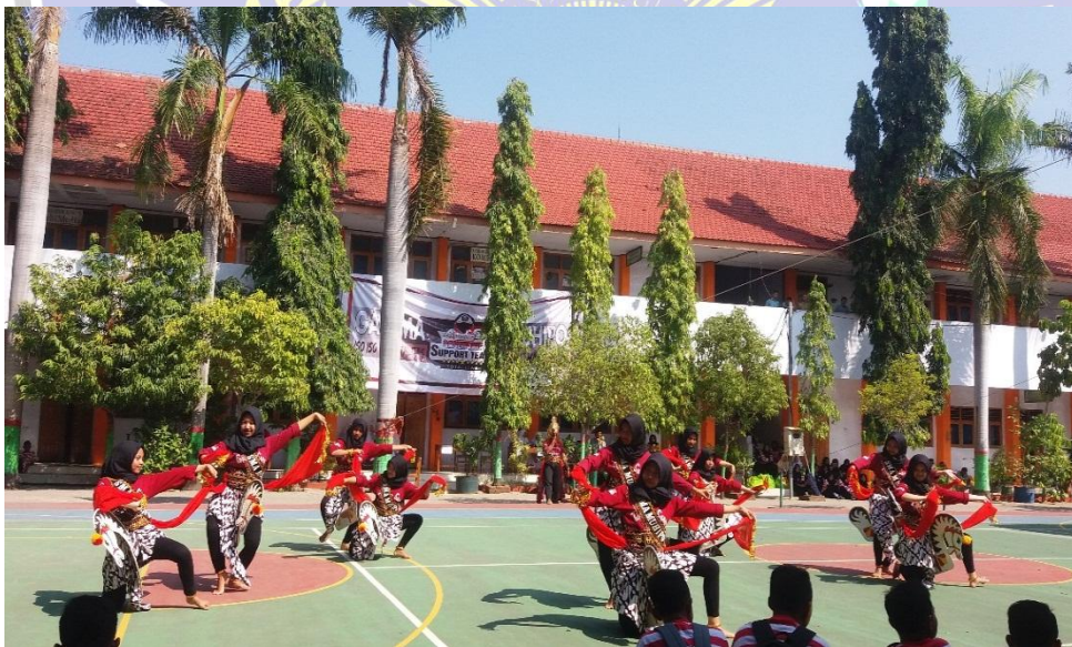
Penari Jathilan Taruno Suryotampil di depan siswa baru