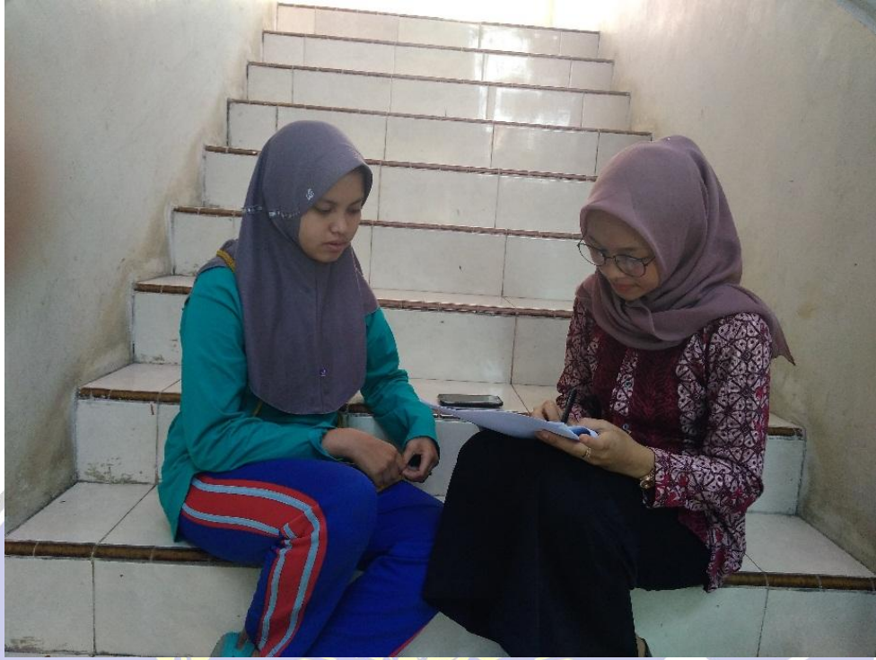
Wawancara dengan siswa