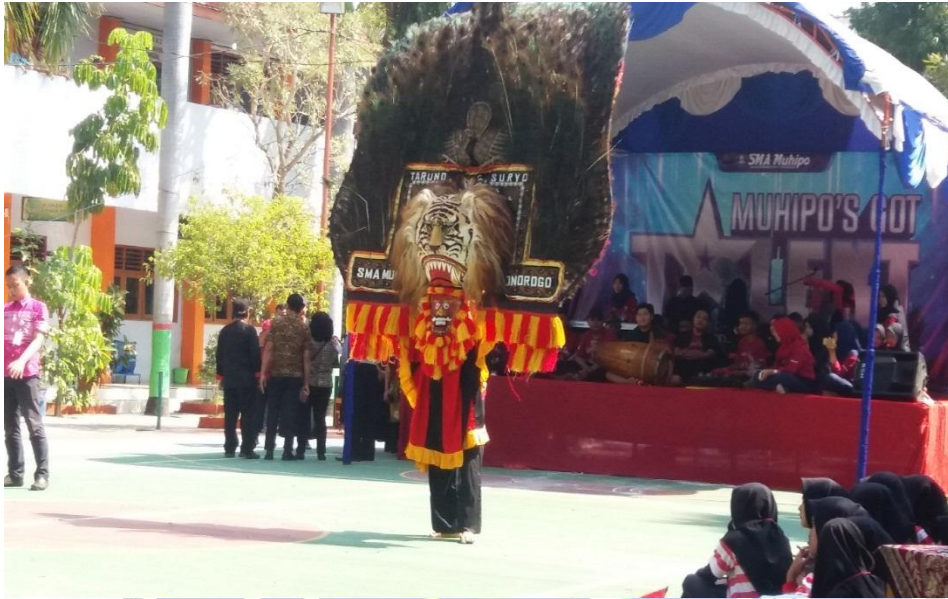
Reyog Taruno Suryotampil di depan siswa baru