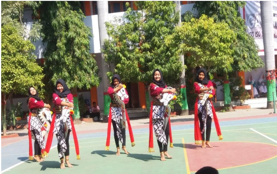
Kesenian tari jathilan tampil didepan siswa baru