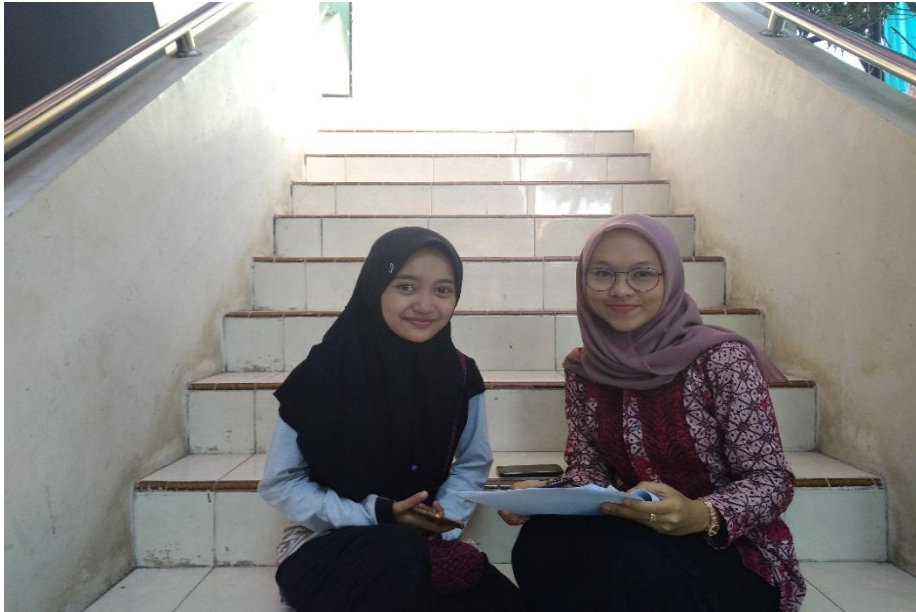
Wawancara dengan siswa