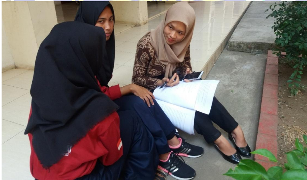
Wawancara dengan siswa