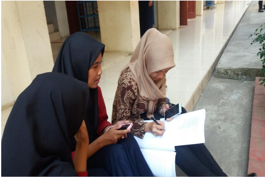
Wawancara dengan siswa