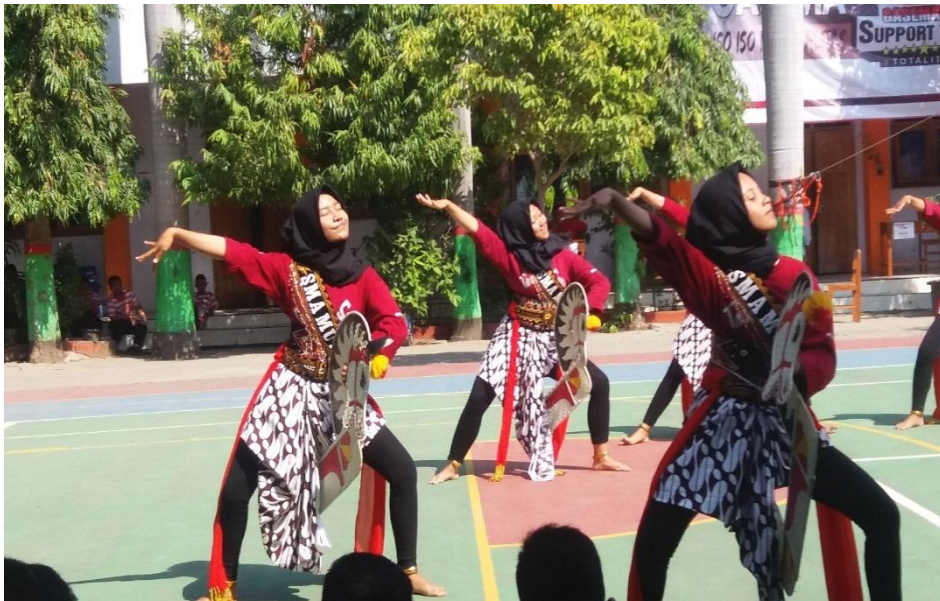
Kesenian tari jathilan tampil didepan siswa baru