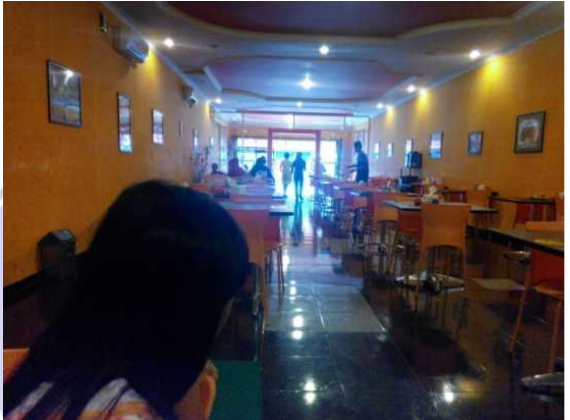
FOTO LOKASI RM BANYU BENING PONOROGO