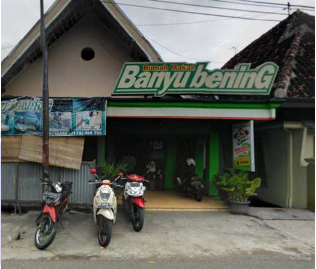
FOTO LOKASI RM BANYU BENING PONOROGO