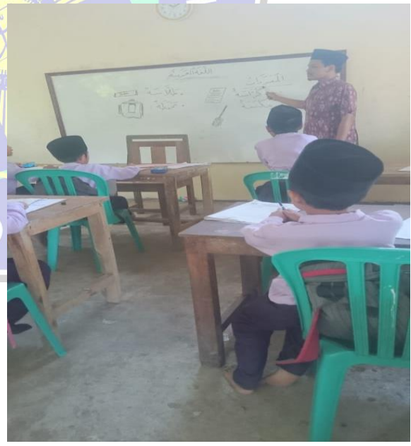
Gambar 2. Siswa antusias dan bersemangat saat mendengarkan guru menerangkan pelajaran