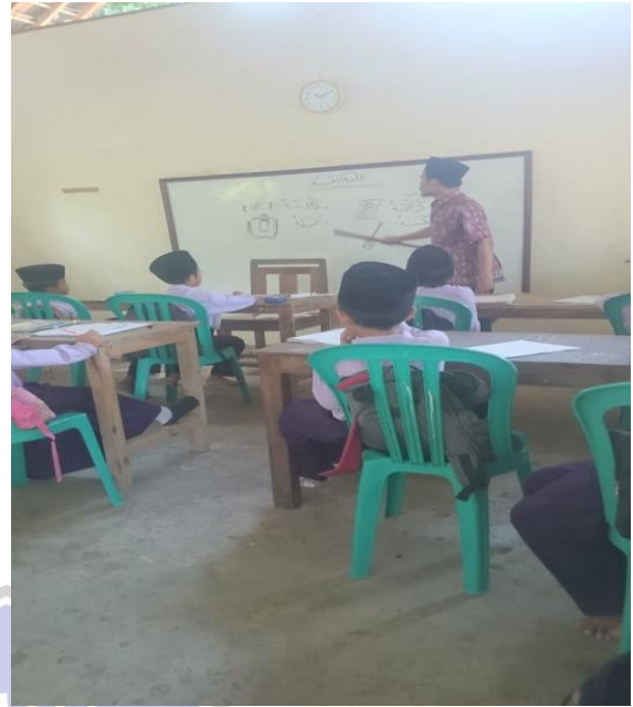
Gambar 3. Guru menguatkan kosakata dengan memberi pertanyaan-pertanyaan yang berkaitan dengan tema adawatulmadrosiah (alat-alat sekolah)