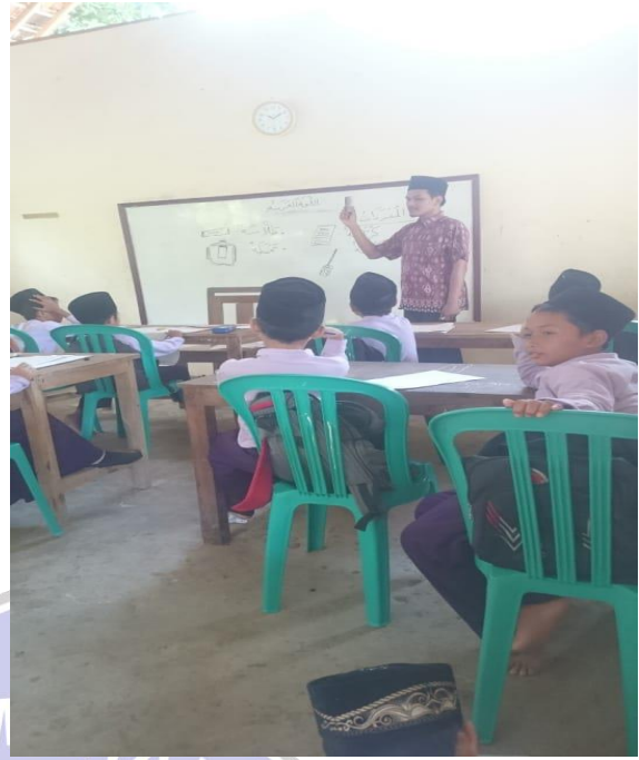
Gambar 1. Guru menerangkan isi bacaan adawatulmadrosiah (alat-alat sekolah) sekolah dengan menggunakan media