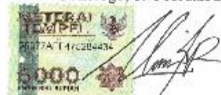
(Moh Munif Rifa'i) NIM 14440803