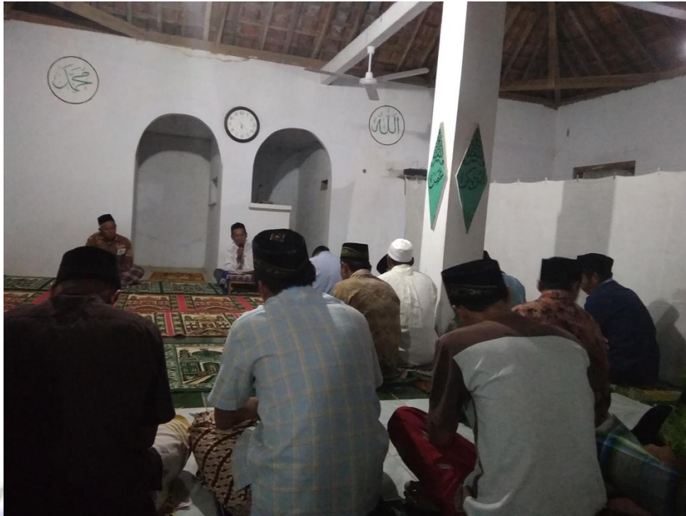
Gambar 3. Foto Kegiatan PPHBN Pengajian Remaja di Dusun Jajar Desa Ngreco Kecamatan Tegalombo Pacitan