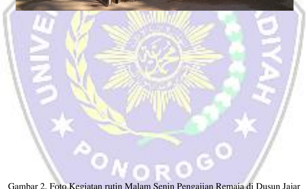
Gambar 2. Foto Kegiatan rutin Malam Senin Pengajian Remaja di Dusun Jajar Desa Ngreco Kecamatan Tegalombo Pacitan