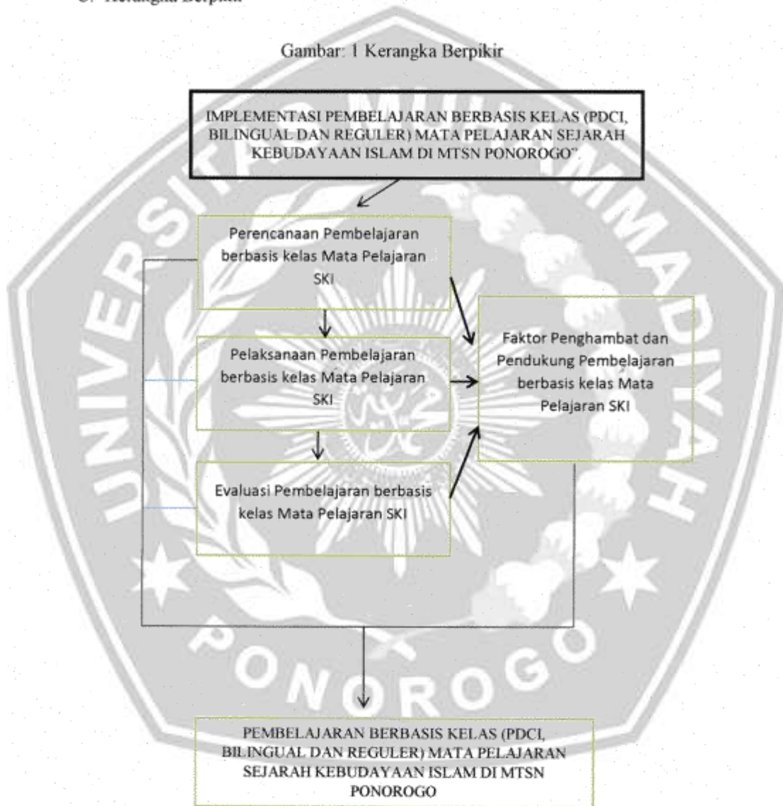
Gambar: 1 Kerangka Berpikir