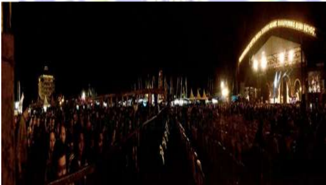
Kondisi penonton saat pelaksanaan FRN Tahun 2013