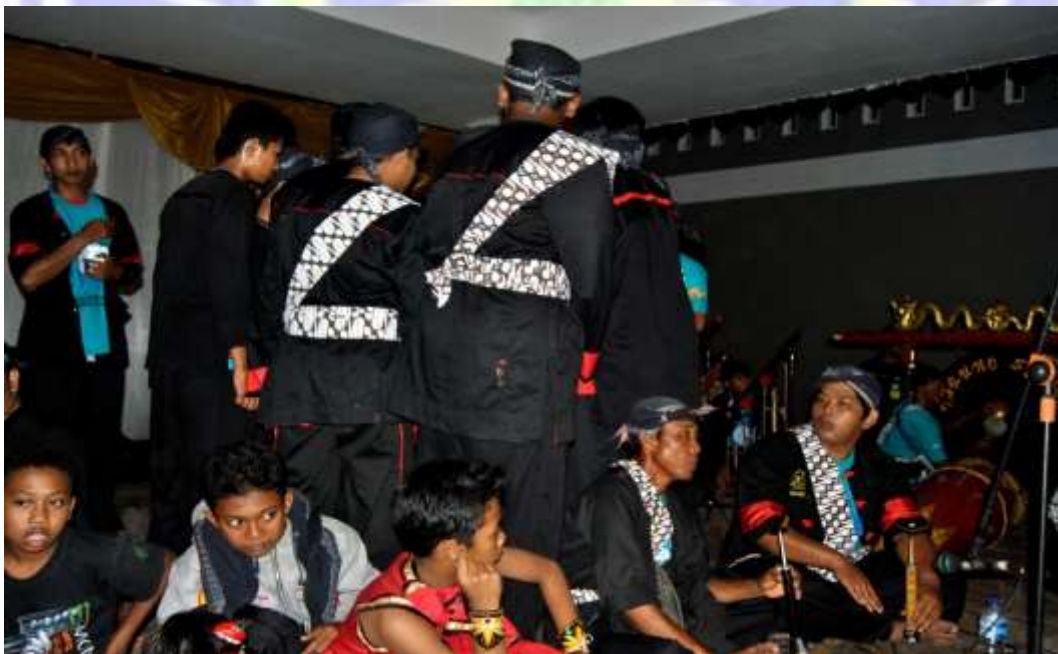
Kondisi panggung pengrawit saat pelaksanaan FRN di Kabupaten Ponorogo