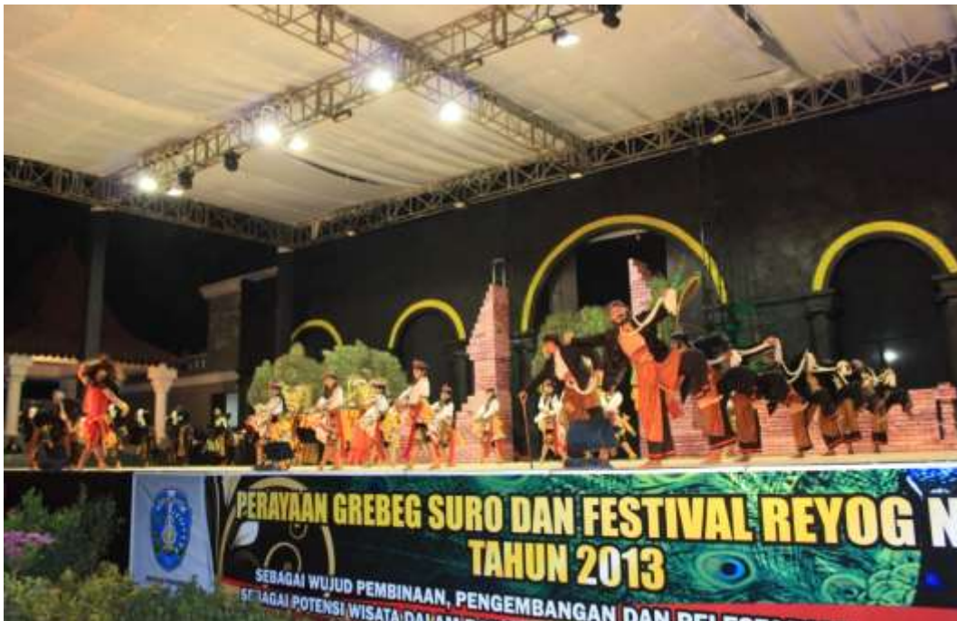
Kondisi penyelenggaraan FRN panggung utama alon-alon Ponorogo dari arah depan