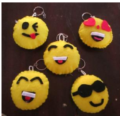
Gambar 2. Hasil Kreasi Flanel Gantungan Kunci

Setelah mengenal bahan dan alat yang digunakan untuk membuat souvenir dari kain flanel (gantungan kunci, bros dan buket bunga) para peserta ditunjukkan karya-karya yang dibuat dari bahan flanel, ada sekitar 15 kerajinan yang bisa dibuat dari kain flanel oleh pematerinya. Selanjutnya para peserta diajak langsung praktek pembuatan souvenir . Pertama yang dipraktikkan adalah pembuatan gantungan kunci. Peserta diajari mulai dari memotong kain dengan pola sesuai ukuran yang dibutuhkan.