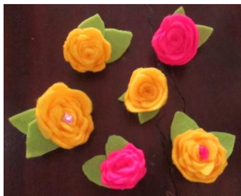
Gambar 3. Hasil Kreasi Flanel Bros