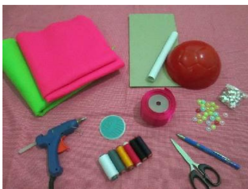
Gambar 1. Bahan dan Alat yang digunakan untuk membuat buket bunga

Pelatihan pembuatan souvenir dari kain flanel (gantungan kunci, bros dan buket bunga) ini diikuti oleh 24 peserta. Materi yang akan diberikan pada pelatihan ini adalah pembuatan gantungan kunci, bros dari kain flanel dan buket bunga. Dari semua peserta yang hadir belum ada yang pernah membuat kerajinan dari kain flanel. Untuk itu langkah pertama kali yang diberikan dalam pelatihan ini adalah pengenalan bahan dan alat-alat yang digunakan. Gambar 1 menunjukkan alat dan bahan yang digunakan untuk membuat kreasi flanel buket bunga. Terdiri dari kain flanel, kardus bekas, pipa, lem tembak, jarum dan benang, tali pita, gunting pensil, dan manik-manik.