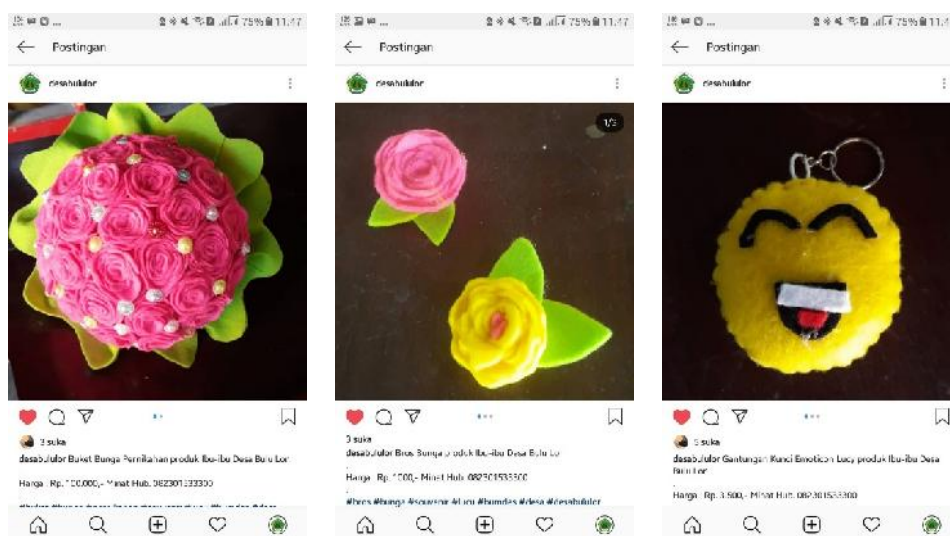
Gambar 8. Postingan Produk di Instagram

Pelatihan penjualan online selanjutnya ada praktek cara posting produk dan promosi di sosial media Instagram, berikut produk-produk yang telah di posting di Instagram.