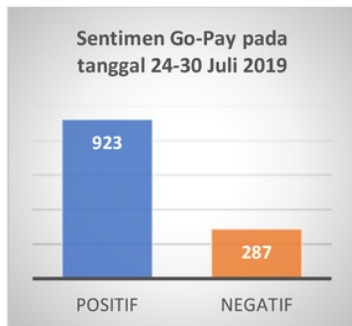
Gambar 5 Diagram jumlah data pelabelan Hasil pelabelan diatas menunjukkan dari data tweet berjumlah 1210, menghasilkan frekuensi sentimen positif berjumlah 923 yang lebih tinggi

Setelah data hasil pelabelan didapat, selanjutnya semua data sentimen dijumlah sesuai dengan kelasnya. Hasil penjumlahan ditunjukkan pada diagram Gambar 5.