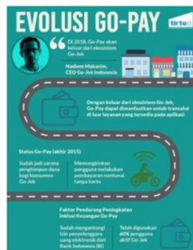
Gambar 1 Evolusi Go-Pay

Kemajuan teknologi membuat segala macam layanan diakses secara digital. Mulai dari transportasi hingga transaksi mengalami digitalisasi. Saat ini uang dalam bentuk fisik mulai dikurangi penggunaannya karena kurang efektif jika dibawa dalam jumlah banyak. Selaras dengan perkembangan dompet digital di Indonesia yang mulai diminati masyarakat salah satunya adalah Go-Pay. Go-Pay merupakan layanan dompet digital yang dimiliki perusahaan Gojek. Pada awalnya Go-Pay hanya bisa digunakan untuk pembayaran jasa transportasi saja. Namun Nadiem CEO Gojek ingin Gojek lebih berkembang dari sekedar transportasi online, Gojek ingin bertransformasi menjadi sebuah fintech atau financial technology melalui layanan Go-Pay. Go-Pay nantinya bisa digunakan sebagai alat pembayaran untuk transaksi di luar layanan aplikasi seperti ditunjukkan pada Gambar 1 ( www.tirto.id ).