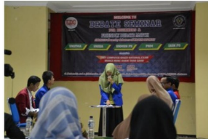
Gambar 3: Dokumentasi FriDatE

agar mereka yang memiliki potensi debat bisa bergabung pada komunitas debat supaya mereka bisa mengembangkan potensi debat yang mereka miliki.