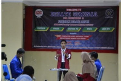
Gambar 4: Dokumentasi FriDatE

di Jawa Timur dan luar Jawa dengan tujuan mahasiswa dapat berpartisipasi dalam kegiatan-kegiatan yang dapat mengembangkan kemampuan debat mereka.