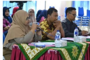
Gambar 5: Dokumentasi FriDatE

mengulang-ulang debat dengan cara yang sama dengan mempelajari secara independent buku panduan yang di-download.