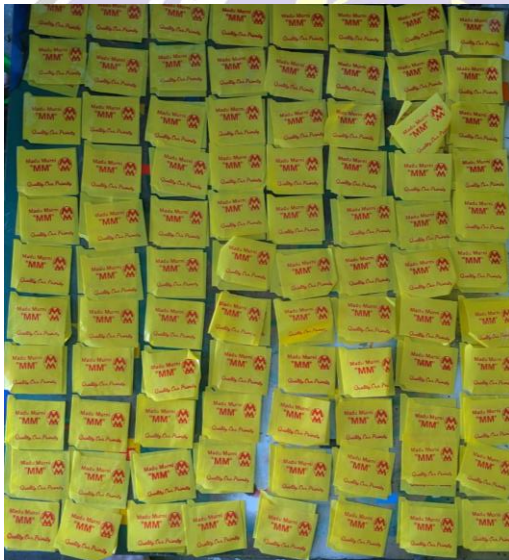
Plastik kemasan yang sudah disablon dan sedang dikeringkan