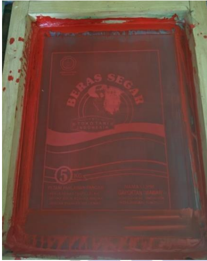
Screen yang telah di afdruk