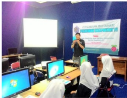
Gambar 2. pengenalan Board Raspberry