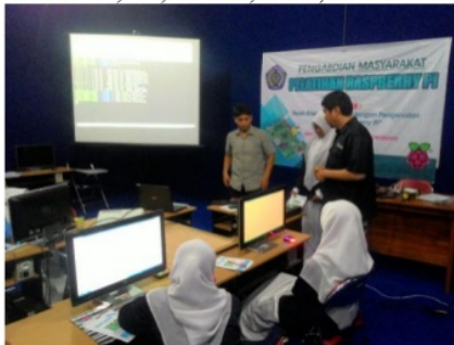
Gambar 3. Pengenalan Interaksi IO