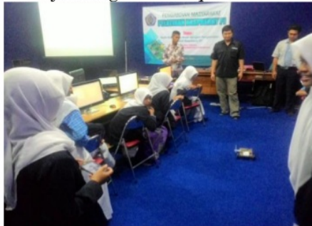
Gambar 6. Praktek kendali robot dengan perangkat smartphone