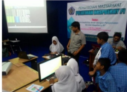
Gambar 4. Praktek Input Output