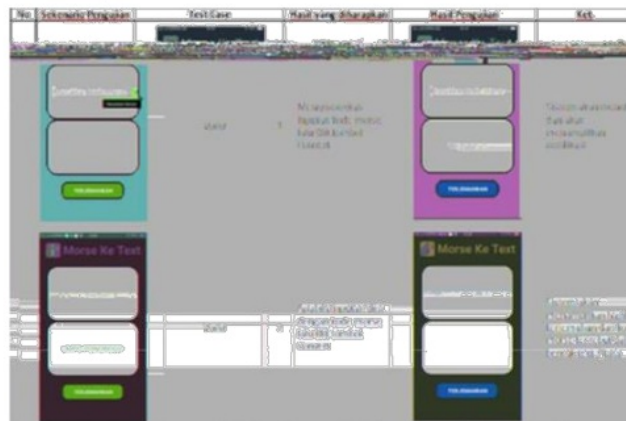
Gambar 4 Skenario Test Form Terjemahan Morse ke Text

Skenario pengujian ini untuk mengetahui apakah pengujian pada halaman terjemahan Text ke Morse bisa berjalan dengan baik tanpa mengisi kata atau huruf yang akan di terjemahkan, jika sistem menolak pengujian maka akan menampilkan notifikasi atau menampilkan pesan. Jika kata atau huruf diinputkan berarti sistem akan menampilkan output berupa sandi morse dari terjemahan kata tersebut.