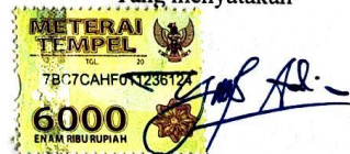
YUSUFA DIO HERMAWAN NIM 15612692