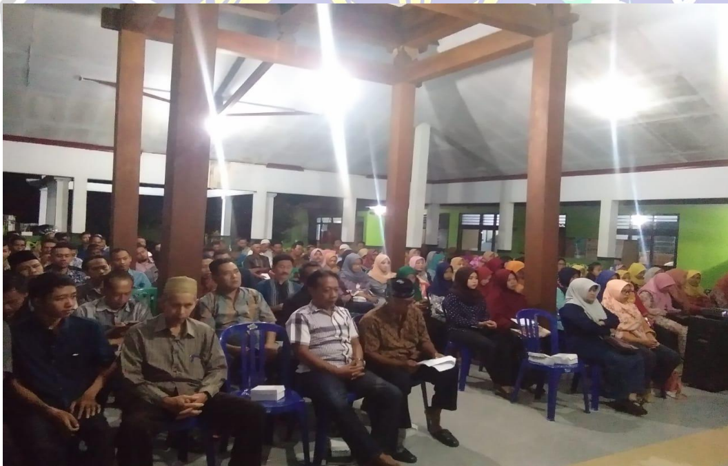
Gambar 1.3 Kegiatan Sosialisasi Pemilu 2019 Di Balai Kelurahan Kadipaten