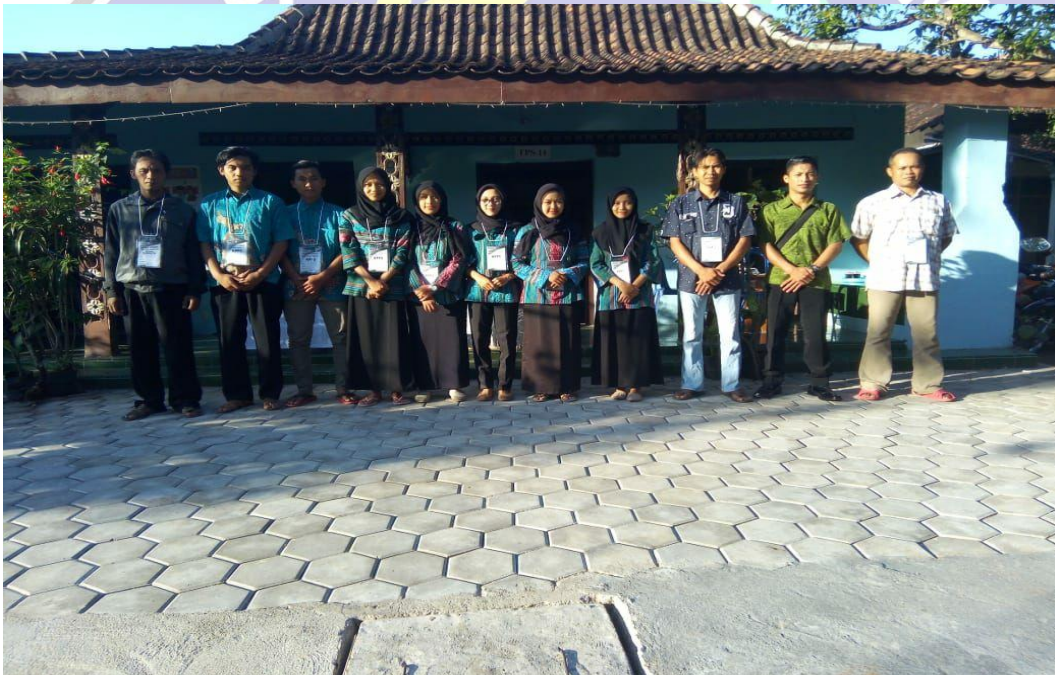
Gambar 1.4 Anggota KPPS, Panwas, Linmas, Saksi Dan Juga Panwas.