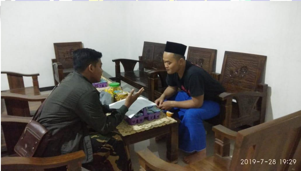
Gambar 1.1 Kegiatan Wawancara Dengan Responden Pemuda/Pemudi Kelurahan Kadipaten