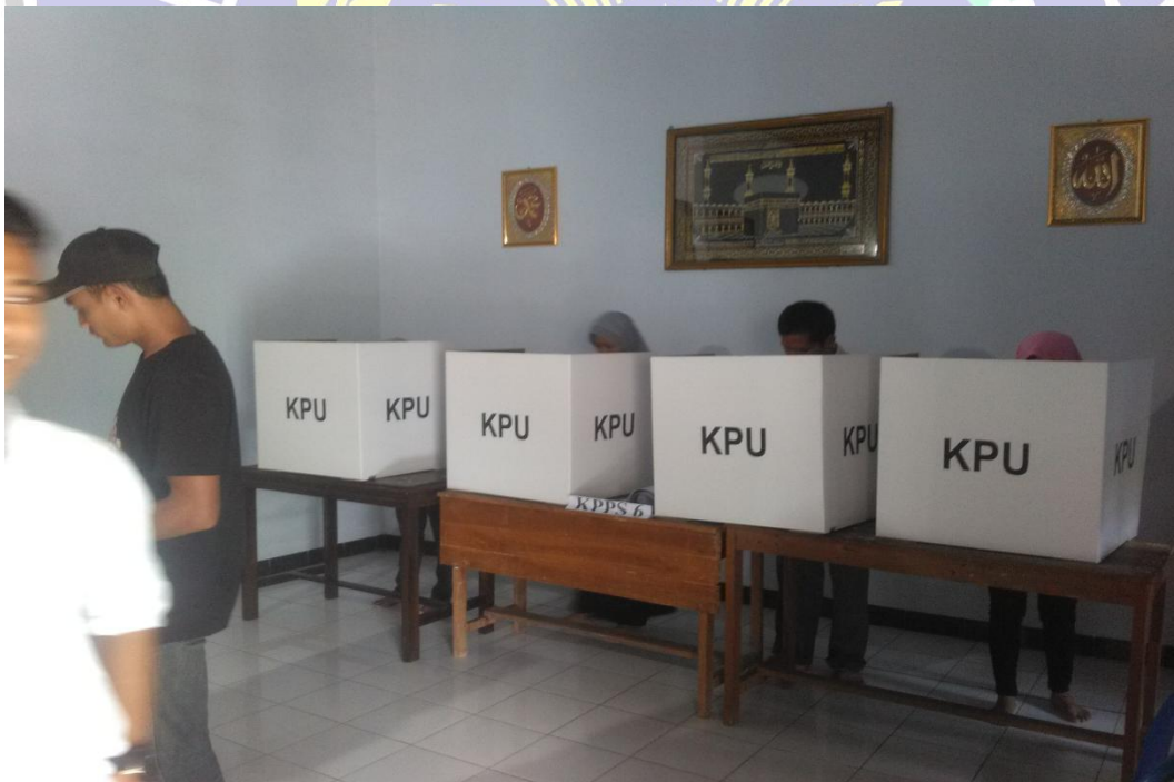
Gambar 1.2 Partisipasi Warga Masyarakat Kelurahan Kadipaten Di Lokasi TPS