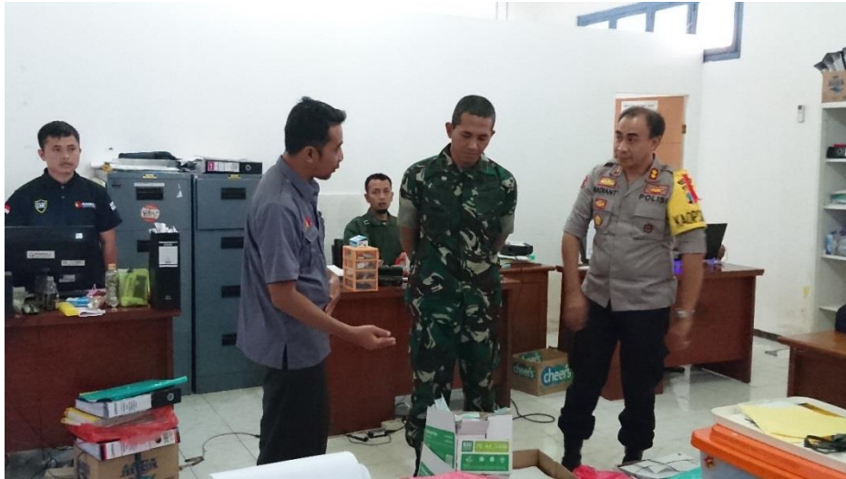
Pengawasan di Sekretariat Bawaslu