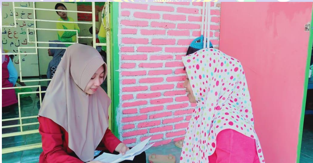
Wawancara Dengan Guru