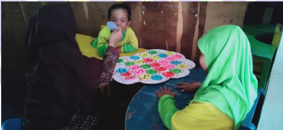
Pembelajaran di Dalam Kelas (Satu Guru Dua Murid)