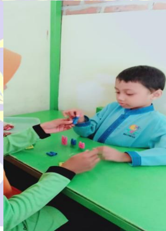
Pembelajaran di DalamKelas (Satu Guru SatuMurid)