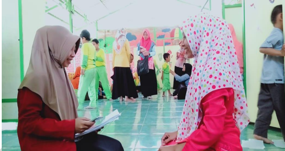
Wawancara Dengan Guru