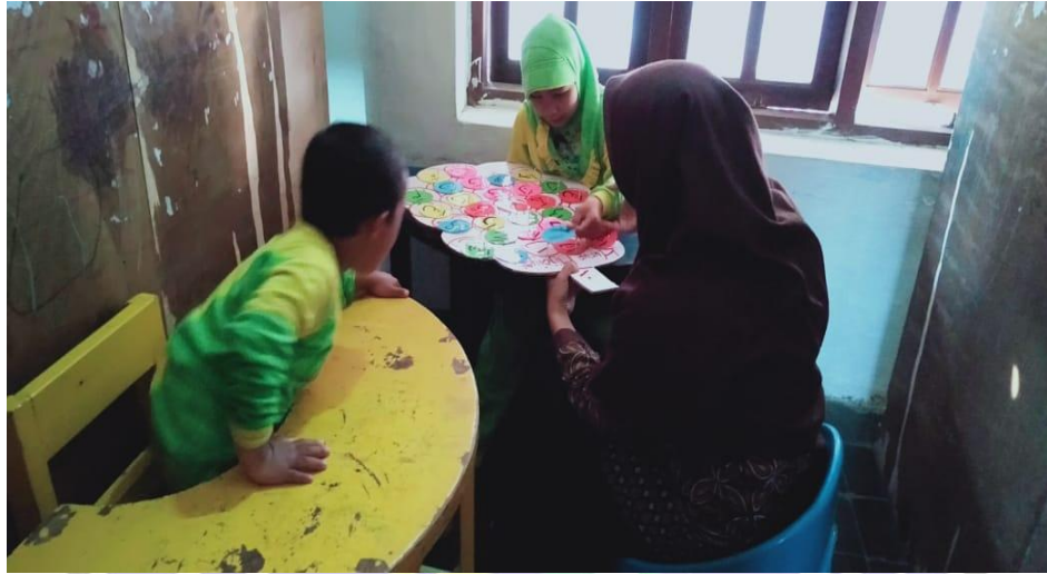
Pembelajaran di Dalam Kelas (Satu Guru Dua Murid)