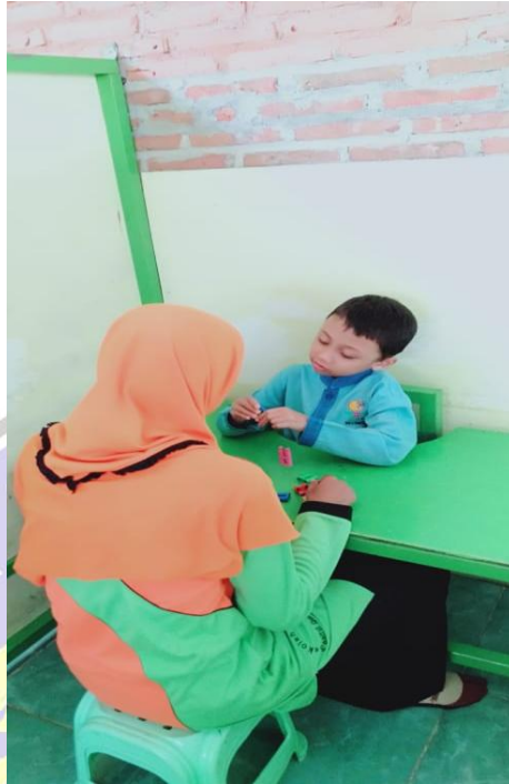
Pembelajaran di DalamKelas (Satu Guru SatuMurid)