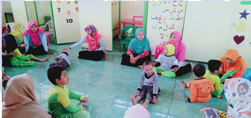
Pembelajaran di Dalam Kelas (Klasikal/Kelompok)