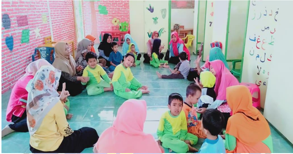
Pembelajaran di Dalam Kelas (Klasikal/Kelompok)