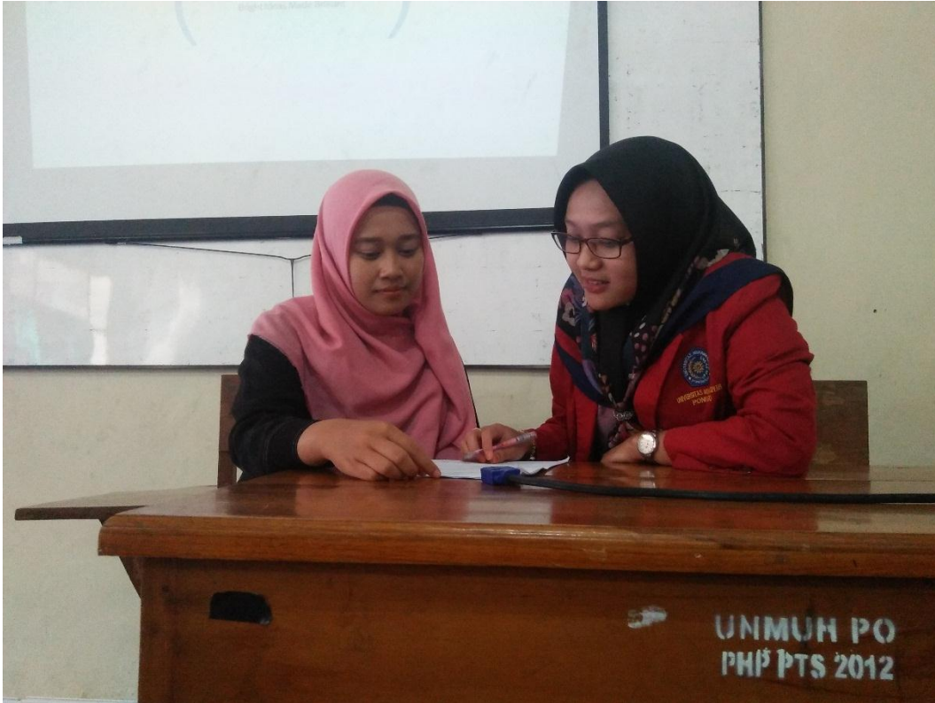
Dokumentasi Wawancara dengan Mahasiswa semester 6 Prodi PPKn