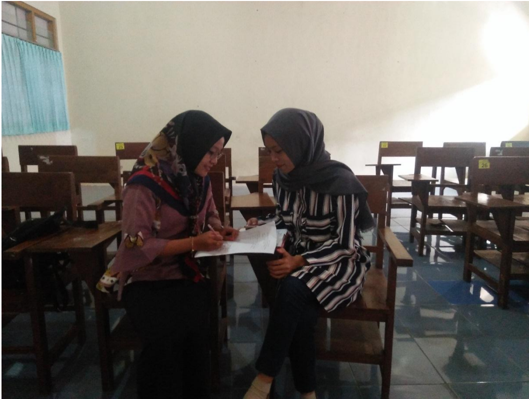
Dokumentasi Wawancara dengan Mahasiswa semester 6 Prodi PPKn