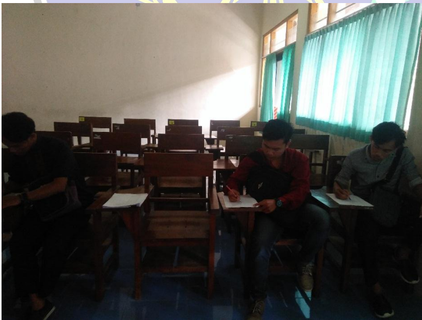
Dokumentasi Wawancara dengan Mahasiswa semester 6 Prodi PPKn