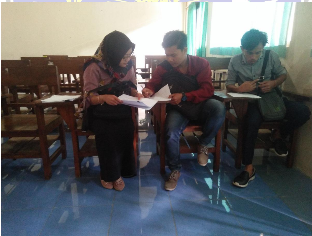
Dokumentasi Wawancara dengan Mahasiswa semester 6 Prodi PPKn