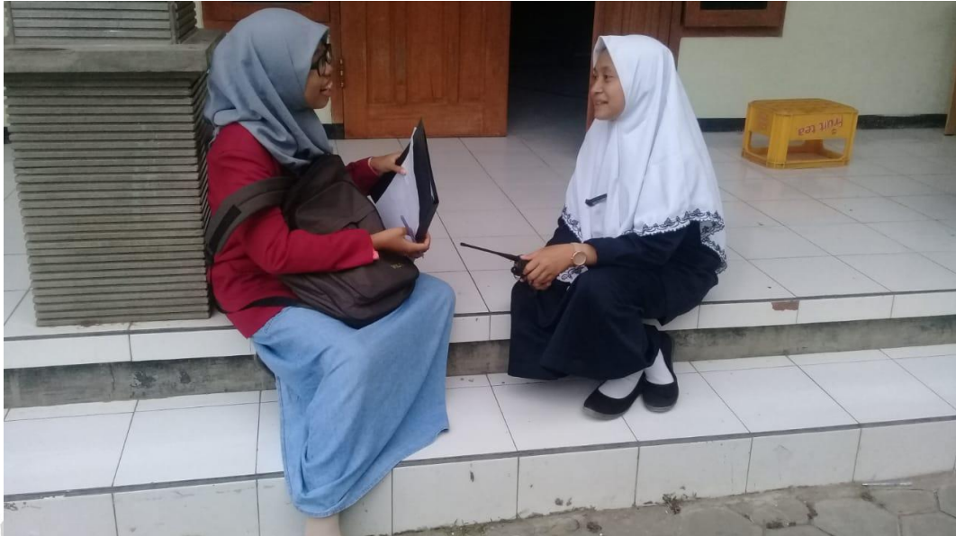
Gambar 1. Wawancara dengan santriwati Pondok Pesantren Walisongo Putri Ngabar Ponorogo