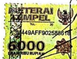
Fatika Bella Ayunda