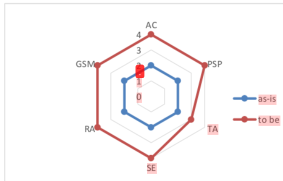
Gambar 2. Grafik target maturity level AI3

Adapun rekomendasi perbaikan pada subdomain AI3 dapat digambarkan seperti pada Gambar 2. Grafik target maturity level AI3.