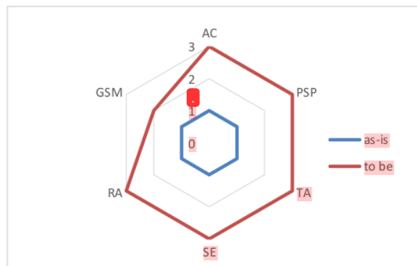
Gambar 3. Grafik target maturity level A15

Adapun rekomendasi perbaikan pada subdomain A15 dapat digambarkan seperti pada gambar 3. Grafik target maturity level A15.