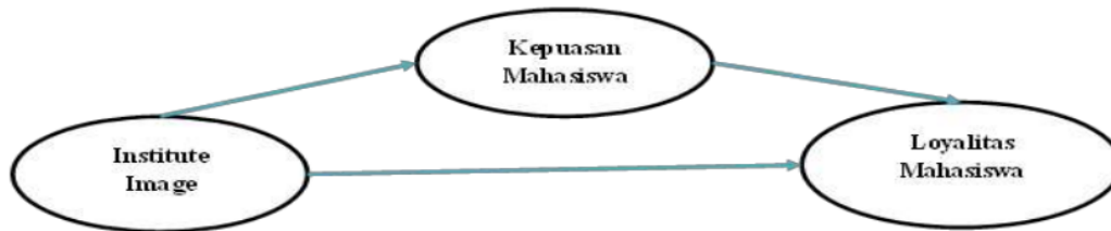
Gambar 1. Model empirik penelitian

Berdasarkan kajian pustaka, maka pembangunan kerangka pikiran teoritik dalam penelitian ini adalah sebagai berikut: