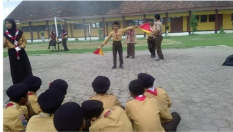
Gambar 3 Praktik semaphore

bersahabat/komunikatif agar terwujudnya kerja sama yang baik dengan anggota regunya serta kepercayaan diri peserta didik dalam memperagakan bendera. Berikut ini merupakan gambar 3 praktik dari semaphore dengan regunya. Seperti yang disampaikan oleh Yuliani, dkk (2016: 243) bahwa Siswa memperagakan gerakan. Karakter yang ditanamkan adalah percaya diri dan komunikatif.