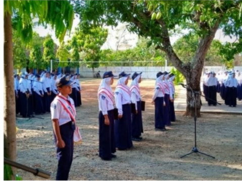
Gambar 4 Kegiatan upacara hari senin

dengan arahan dari guru. Berdasarkan hasil pengamatan, nilai karakter disiplin juga nampak saat upacara bendera yang rutin dilaksanakan pada hari senin. Berikut ini gambar 4 Kegiatan upacara hari senin.