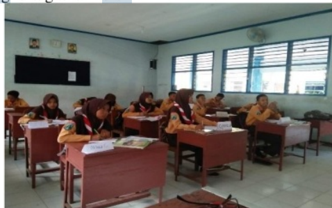
Gambar 5 peserta didik mengerjakan tugas

guru. Bahkan jika ada pekerjaan rumah juga dikerjakan di rumah. Hal ini merupakan wujud dari nilai karakter tanggung jawab. Adapun kegiatan mengerjakan tugas bisa dilihat gambar 5 di bawah ini.