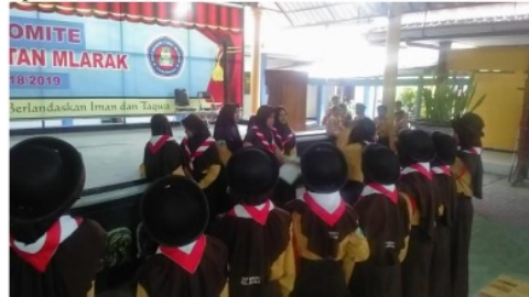
Gambar 1 Wujud karakter berkomunikasi/kerja sama melalui pionering

Pada tanggal 12 dan 19 Oktober 2018 menurut tabel 1 kegiatan pramuka adalah