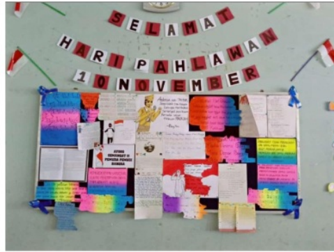
Gambar 6 Mading pada hari pahlawan