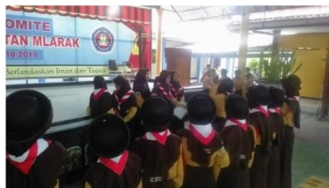
Gambar 2 peserta didik membuat yel-yel dengan regunya

harus dipraktekkan di depan pembina pramuka. Berikut ini gambar 2 kegiatan peserta didik dalam membuat yel-yel dengan regunya. Seperti yang diemukakan oleh Zakaria dkk (2014) bahwa Proses pembentukan nilai gembira: Proses pembentukan nilai gembira ini dilakukan dengan selalu bertepuk Pramuka dalam setiap kegiatan kepramukaan yang dilaksanakan dan selalu menyanyikan yel-yel pramuka pada saat kegiatan perkemahan seperti pada gambar 2.