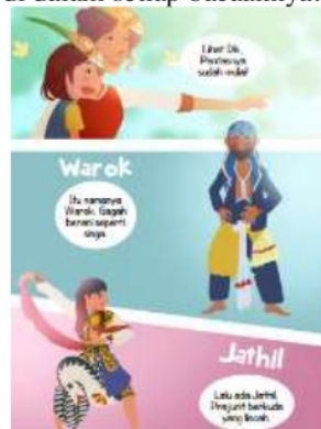
Gambar 1. Komik tokoh pemain reog

Indikator kelengkapan materi ditinjau dari materi yang disajikan sudah sesuai dengan Kompetensi Inti (KI) dan Kompetensi Dasar (KD) yang terdapat di dalam silabus kemudian juga sudah baik dengan alasan bahwa KI dan KD dalam buku ini sudah menunjukkan adanya relevansi dengan materi yang terdapat di dalam komik. KI dan KD dalam komik ini sudah sesuai dengan prinsip dasar kurikulum yang ditujukan untuk mengembangkan pola berpikir para siswa, guru dan orang tua. KI dan KD pada setiap pelajaran sudah terintegrasi untuk membentuk suatu karakter siswa dengan menyelipkan nilai pendidikan karakter di dalam setiap bacaannya.