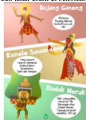
Gambar 2. Nilai-nilai pendidikan karakter tokoh reog

nilai pendidikan karakternya. Nilai pendidikan karakter pada warok ialah tokoh yang terdapat dibarisan paling depan seperti komandan perang, dan terlihat menyeramkan menurut (Rahmawati, 2016: 8). Selanjutnya, seorang warok biasanya berbadan kekar, dengan sikap tubuh yang tegap, dan melakukan gerakan tariannya biasanya bersama-sama. Berdasarkan hal demikian, maka dapat diambil nilai pendidikan karakternya bahwa seorang warok itu memiliki karakter yang sehat, tegap, pemberani, toleransi, bertanggung jawab, dan pekerja keras. Sedangkan, pemain jathilan terdapat nilai karakter juga yakni meskipun berpenampilan ksatria namun hatinya feminim, dengan menunggang kuda lumping, nilai pendidikan karakter yang terdapat pada jathilan ialah seorang anak harus mampu menjadi ksatria bagi dirinya sendiri, namun harus lembut kepada siapa saja, terutama kepada kedua orang tuanya. Hal seperti ini yang hendaknya dapat disampaikan kepada siswa PAUD sejak dini guna mengenalkan kearifan lokal yang ada di daerah setempat sekaligus sebagai ajang untuk menanamkan pola asuh kepada anak didik di sekolah.