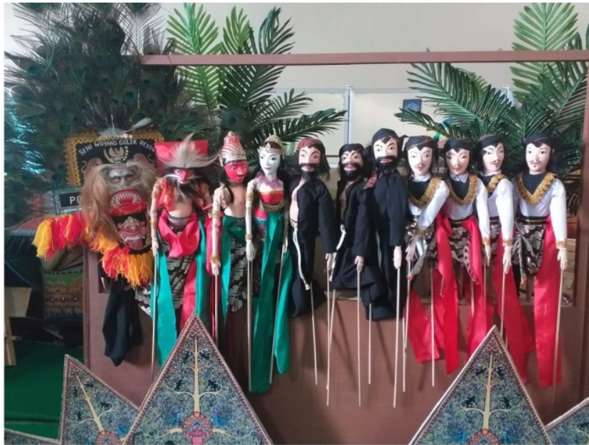
Gambar 1. Wayang Golek Reyog Ponorogo

Pencipta: : 1. Dr. Sulton, M.Si 2. Betty Yulia Wulansari, M.Pd 3. Prihma Sinta Utami, M.Pd Ciptaan : Wayang Golek Reyog Ponorogo Dengan Tokoh: 1. Prabu Klono Sewandono 2. Patih Bujang Ganong 3. Dadak Merak/ SingoBarong 4. Putri Songgolangit 5. Prabu Sri Gethayu /Raja Kerajaan Kediri/ Ayah Putri Songgolangit 6. Guru Brahmana/ Guru Prabu Klono Sewandono 7. Mbok Emban 8. Warok 9. Prajurit Jaran Jathil Jenis : Purwarupa