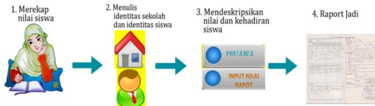
Gambar 1. Proses Penulisan Raport Manual

Dengan terobosan yang ditawarkan penulis untuk membuat laporan perkembangan anak didik dengan menggunakan program aplikasi, guru menyambutnya dengan senang dan antusias. Mereka bisa melakukan konversi nilai angka ke dalam deskripsi kalimat secara otomatis. Mereka juga merasa terbantu dengan adanya himbuan pemerintah agar sekolah TK untuk melakukan penyesuaian dengan kurikulum 2013. Mereka berharap temuan ini bisa mempermudah mereka dalam mengerjakan laporan perkembangan anak menjadi lebih efektif dan efisien.