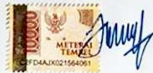
(Galih Erwinda) NIM.16441327