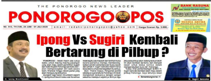
Gambar 3. Headline Harian Lokal Ponorogo Pos, dengan Tajuk “ Ipong vs Sugiri” kembali bertarung di Pilbub.

hingga pertengahan tahun 2020 (Nanang, 2020).