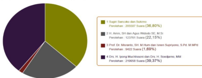
Gambar 2. Hasil perolehan suara Kabupaten Ponorogo Tahun 2015