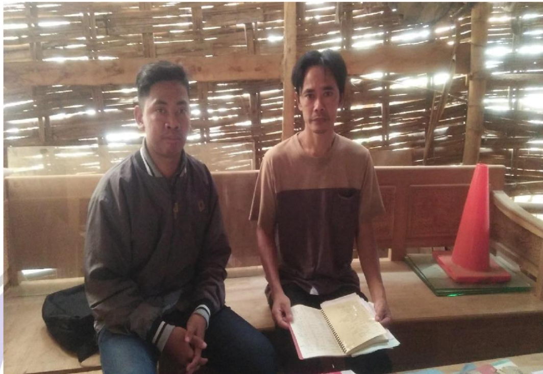
Lokasi UD. Istana Jati Meubel