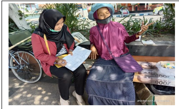
Penelitian dan wawancara dengan pedagang masker di JL. Hosokroaminoto depan SMP N 1 PONOROGO