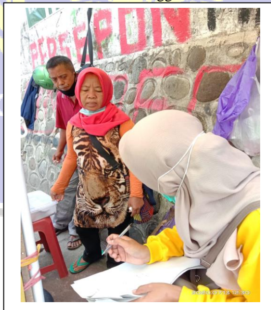
Penelitian dan wawancara dengan pedagang ES BUAH di Jalan Suromenggolo