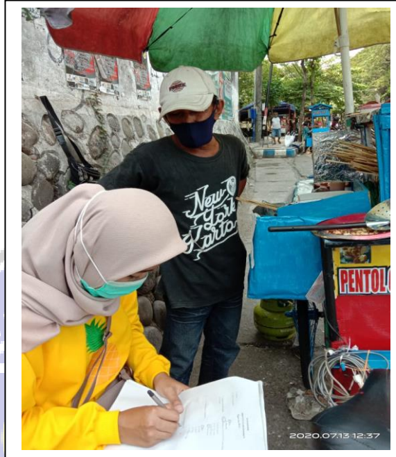
Penelitian dan wawancara dengan pedagang Pentol Goreng di Jalan Suromenggolo