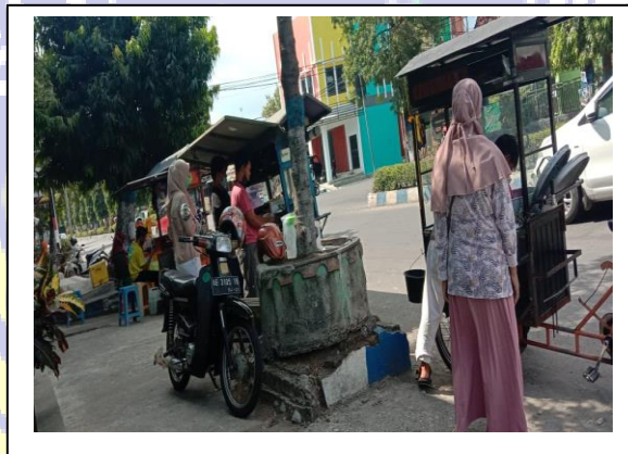
Penelitian dan wawancara dengan pedagang Molen Pisang mini di JL. Sultan Agung atau depan SD Maarif 1 Ponorogo