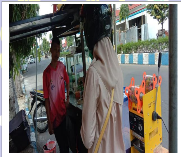
Penelitian dan wawancara dengan Pedagang Gado-gado dan Somay di JL. Ir.Juanda