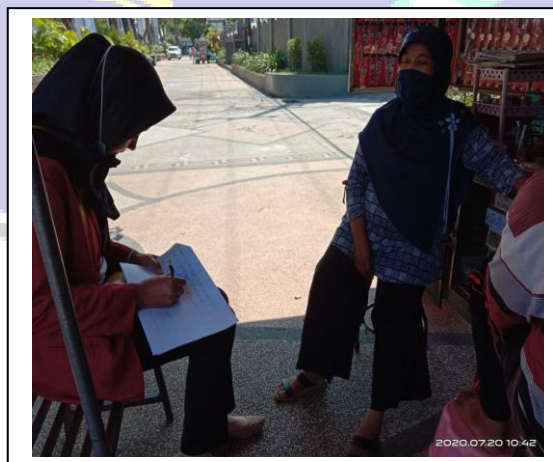
Penelitian dan wawancara dengan Pedagang Accesoris Jam tangan di Depan SMP N 1 Ponorogo