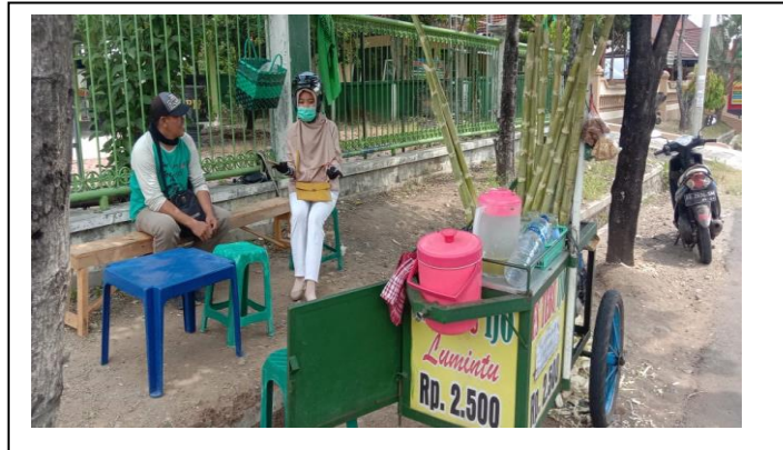
Penelitian dan wawancara dengan pedagang Minuman Sari Tebu di Jl. Budi Utomo