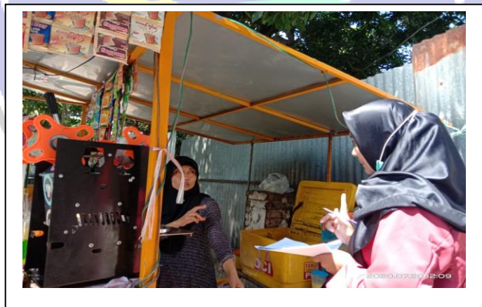
Penelitian dan wawancara dengan pedagang teh poci dan jajanan di JL. Alun-alun utara Ponorogo Timur Kantor Pemda