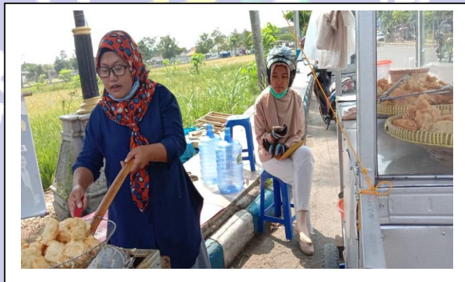
Penelitian dan wawancara dengan Pedagang Gorengan / Jajanan di JL. Suromenggolo