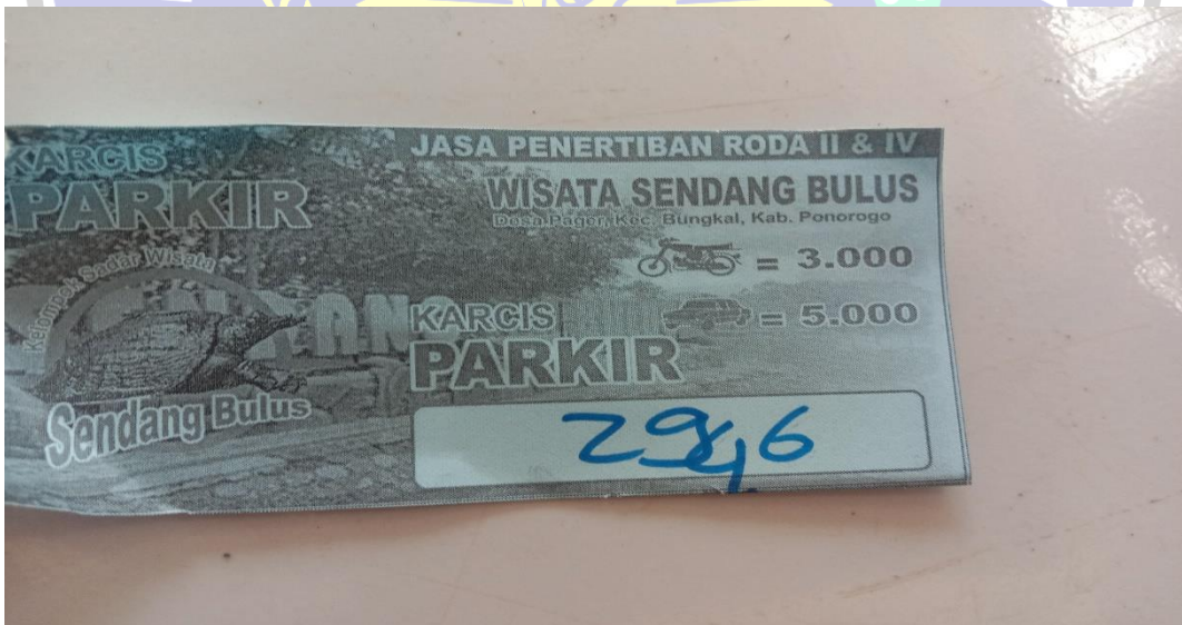
Tiket masuk ketempat wisata